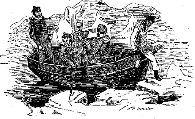
“Η ΜΙΚΡΑ ΒΑΡΚΑ ΕΦΘΑΣΕΝ ΕΞΩ”

“Ἄμα ἐπατοῦσεν ἔξω, ἐπάνω εἰς τοὺς ὄγκους ἐκείνους τῶν ἀδαμάντων, ποῖος θὰ τὸν ἐμπόδιζεν νὰ πάρῃ ὅσον εἰμποροῦσε περισσότερούς καὶ νὰ ζήσῃ πλοῦσιος ὅλην του τὴν ζωὴν;