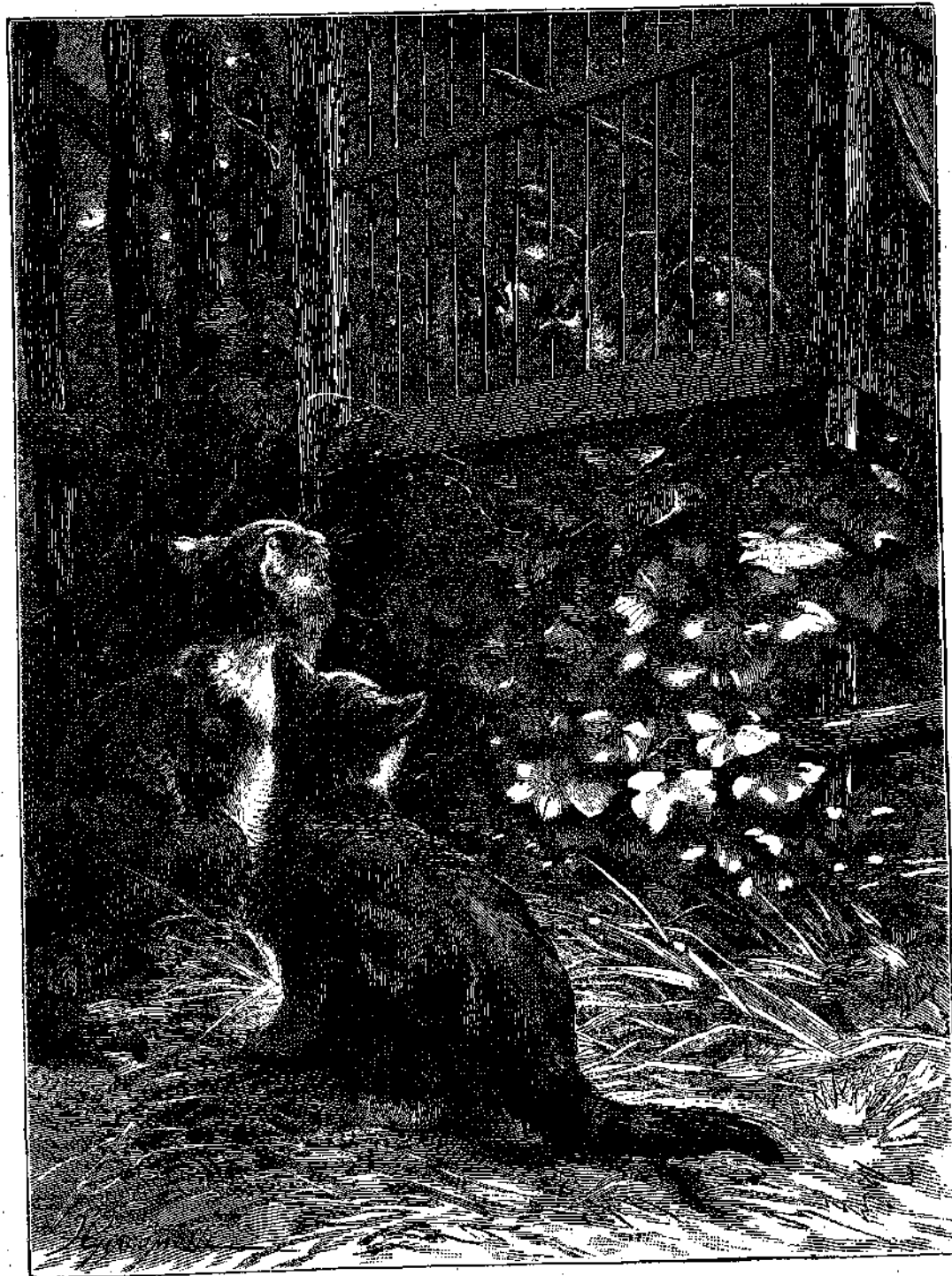
«ΑΧ! ΚΑΙ ΝΑ ΗΤΑΝ ΑΝΟΙΓΜΕΝΗ ΔΙΓΑΚΙ ΤΟΥ ΚΛΟΥΒΙΟΥ Η ΠΟΡΤΑ!...»