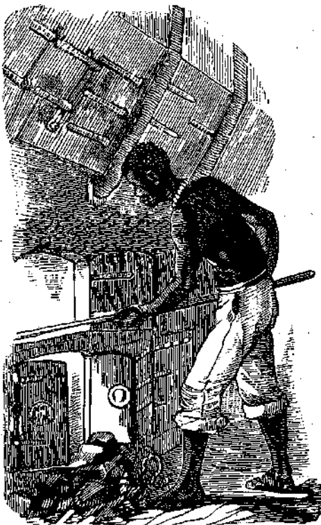
ΕΠΡΕΠΕ ΝΑ ΤΟΝ ΙΔΗΤΕ ΕΙΣ ΤΗΝ ΔΟΥΛΕΙΑΝ

Διότι είναι πολύ δύσκολη αύτή ή εργασία. Φαντάζεστε τί ζέστη θά κάμνη εις τó άμπάρι τού πλοίου, ή, διά νά έννοήσητε καλλίτερα, εις τó τέταρτον πάτωμα κάτω από τó κατάστρωμα; διότι εκεί εύρίσκεται και ό άτμολέβης και αι έστίαί μιάς φρεγάτας ή όποία κινείται με άτμόν.