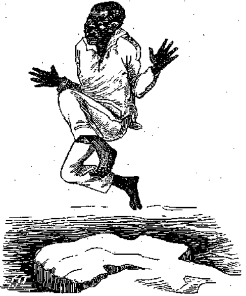
“ΟΧ! ΟΧ! ΚΑΙΕΙ! ΑΙ! ΑΙ! ΚΑΙΕΙ!”