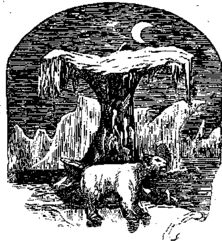
ΑΙ ΛΕΥΚΑΙ ΑΡΚΤΟΙ ΕΙΝΕ ΤΑ ΜΟΝΑ ΤΕΤΡΑΠΟΔΑ ΕΙΣ ΤΗΝ ΓΗΝ ΤΟΥ ΠΥΡΟΣ

Περισσότερον κρύον εις τήν Γήν τού Πυρός κάμνει τόν χειμώνα' τότε θεόρατοι πάγοι έμποδίζουν νά πάγη τις από μίαν νήσον εις άλλην.