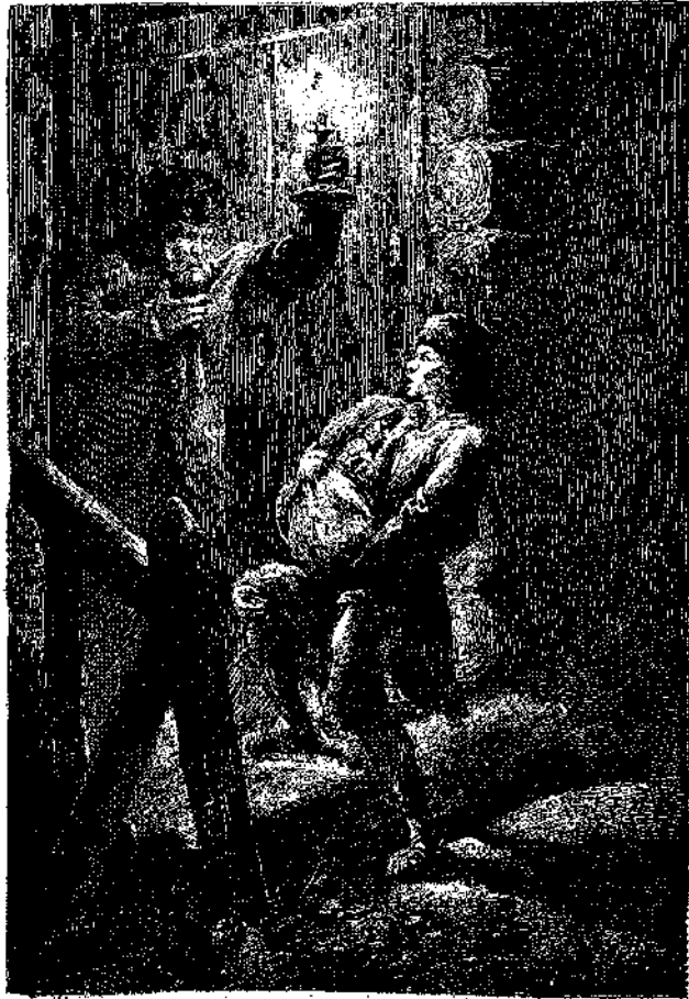
Εἰκὼν ἀπὸ τὸ «ΘΥΜΑ ΤΟΥ ΦΘΟΝΟΥ» (Ἰδὲ σελ. 175)

« Εὐγενεστάτη κυρία μου, ἀν ἤθελα νὰ φι-