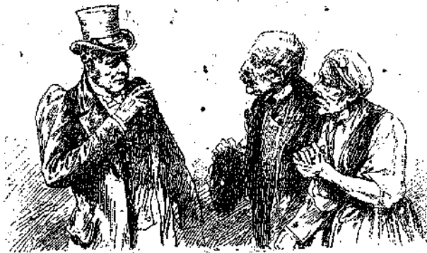
Ο ΙΑΤΡΟΣ ΤΟΙΣ ΕΙΠΕ : « ΜΗ ΔΙΩΞΕΤΕ ΤΗΝ ΓΥΦΤΟΠΟΥΛΑΝ »