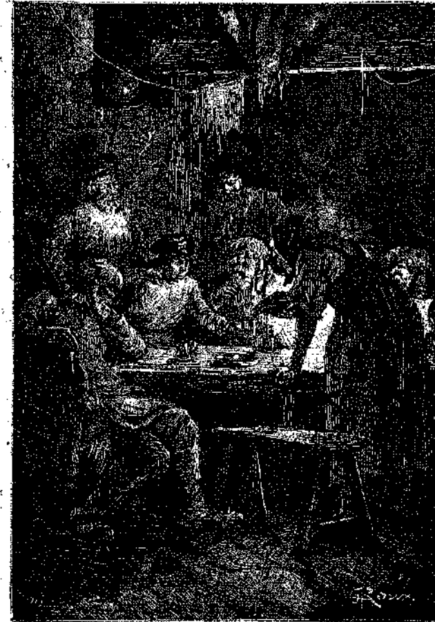
Εἰκὼν ἀπὸ τὸ «ΘΥΜΑ ΤΟΥ ΦΘΟΝΟΥ» (Ἰδὲ σελ. 175)

καὶ δειλίας, ἐκείνη δὲ ὠμίλησε πρὸς αὐτὰ μετὰ φωνῆς ἠπιωτέρας παρὰ τὸ σῆθηες καὶ ἔρριψεν εἰς τὴν ποδιάν τοῦ μικροτέρου κορασίου μίαν δράκα Ζαχαρωτῶν, ἐν ᾧ ταυτοχρόνως ἐθώπευσε φιλοστόργως τὸ εὐτραφέες πρόσωπόν του· ἐκεῖνο δὲ ἀνέβλεψε πρὸς αὐτὴν καὶ ἐμειδίσαε δακρυόεν.