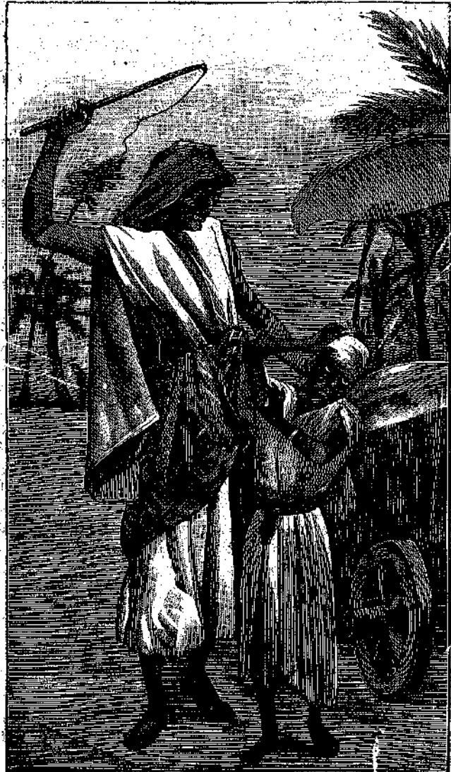
Προτείνα τούς ἰσχυροὺς βραχίονάς της διὰ νὰ προφυλαχθῇ (Σελ. 84, στήλ. α΄)

ἀφαιρῶσι τὸν φελὸν ἐκ τοῦ φλοιοῦ τῶν δρυῶν, αἵτινες παράγουσιν αὐτόν.