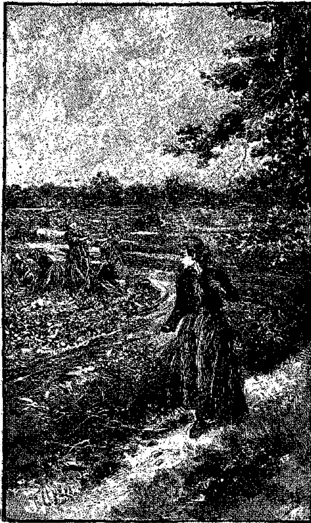
Μωρὴ πού τη βρήκαμε τὴν παλιοκλήτερα (Σελ. 82, στήλ. 6'.)

Χάρην διασκέδασεως καὶ ἐτι μᾶλλον ἔνα κινήθῃ τὸ σῶμά της, ἐπανέθεσεν εἰς τὴν θέσιν τῶν τὰ δεμάτια ἄτινα εἶχε