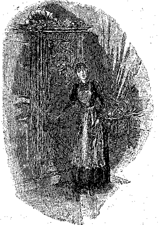
«Η θαλαμηπόλος εισήλθε». (Σελ. 297)

έτρωγα όσα όπωρικά εύρίσκονται εις τὸ τραπέζι. . . . αν μου τα έδιδαν.»