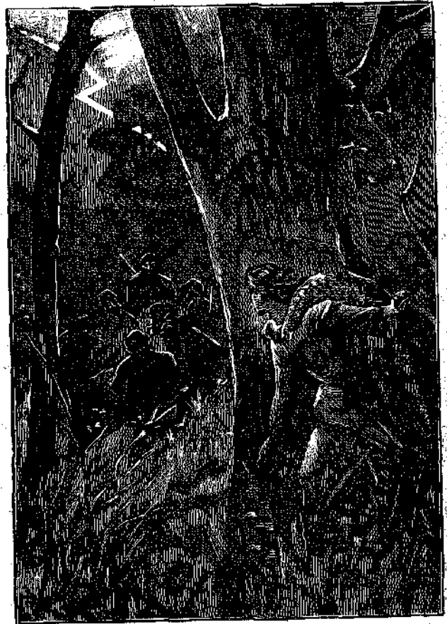
«Ἐστάθῃ ὅπουθεν τοῦ πομποῦ μᾶς γιγαντιαῖες πύκνες.»

Τὴν στιγμὴν ἐκείνην ἤρχισεν ἡ θύελλα νὰ μαίνεται. Ἄλλεπάλληλοι ἀστραπαὶ ἐφώτιζον μὲ μεγάλας καὶ ταχείας λάμψεις, τὸ δάσος, ἐν ᾧ ἐμυλωντο