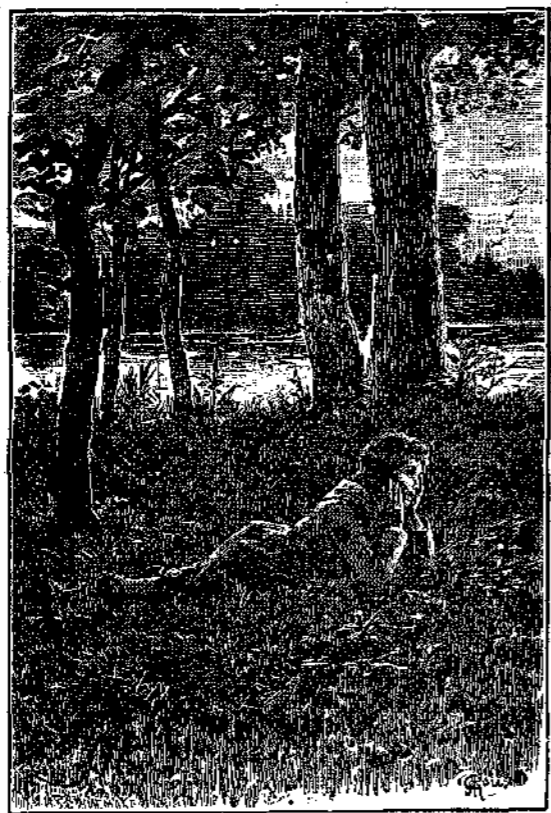
«Έξηπλάνετο κατά γῆσ, και πότε έμενεν έτσι σιωπηλός και συλλογισμένος...» (Σελ. 332, στήλ. α')

Επέρασαν τρεις-τέσσερες ημέραι. Έμπορούσε να ειπῆ κανείς ότι ή παι- δρότης έφυγεν από την Λάνδην προτή- τερα από τὰ παιδιά. Ο Ζοζόσ δέν εδει- γχε πλέον τὰ κατάσπρα δόντια του· ό Γιαννάκης δέν έπαιξε πλέον με τους σκύλους· προς τί, άφ' ού μετ' όλιγον θά τους έχωρρίζετο διά πάντα;. . . Συχνά έπήγανεν εις τό δάσος μόνοσ του, έξη- κλιάνετο κατά γῆσ, και πότε έμενεν έτσι σιωπηλός και συλλογισμένος, πότε έκρυπτε τό πρόσωπόν του μέσα εις την χλόην και έκλαιγε, έκλαι- γε πικρά όσα έμελλε νάφῆσῃ. Τού έφαινετο ότι έβλεπε διά πρώτην φοράν την ώραϊαν λίμνην, ή όποία προς τό βράδυ έγίνετο κατάχρυση από τόν ήλιον, που έ- νόμίζεσ ότι έγερνε διά νά λουσθῆ εις τὰ νερά της. . . Αί πάπια έφώλιαζαν μέσα εις τούς σχοίνους και άκουεσ τὰ ατελείωτά των πᾶ! πᾶ! πᾶ! . . . Τί ώρα που ήσαν όλ' αυτά! Άρά γε τό Παρίσι ήταν τόσος μεγάλο, και είχε τόσα πουλιά;. . . Τί είχε πᾶ- θη έξαφνα ή Μηλιά, που ήταν πάντα φρόνιμη και συνετή σαν μητέρα;. . . Δέν ήθελε νά φανε- ρώσῃ τίποτε εις τόν αδελφόν της· άλλα έφαινετο άρρωστη, και ή μαγεϊρισσα δέν την είχε καταφέ- ρῃ νά φάγῃ τίποτε, ούτε ραγού με πατάτες, διά τό όποϊον έτρελλαί- νετο. . .