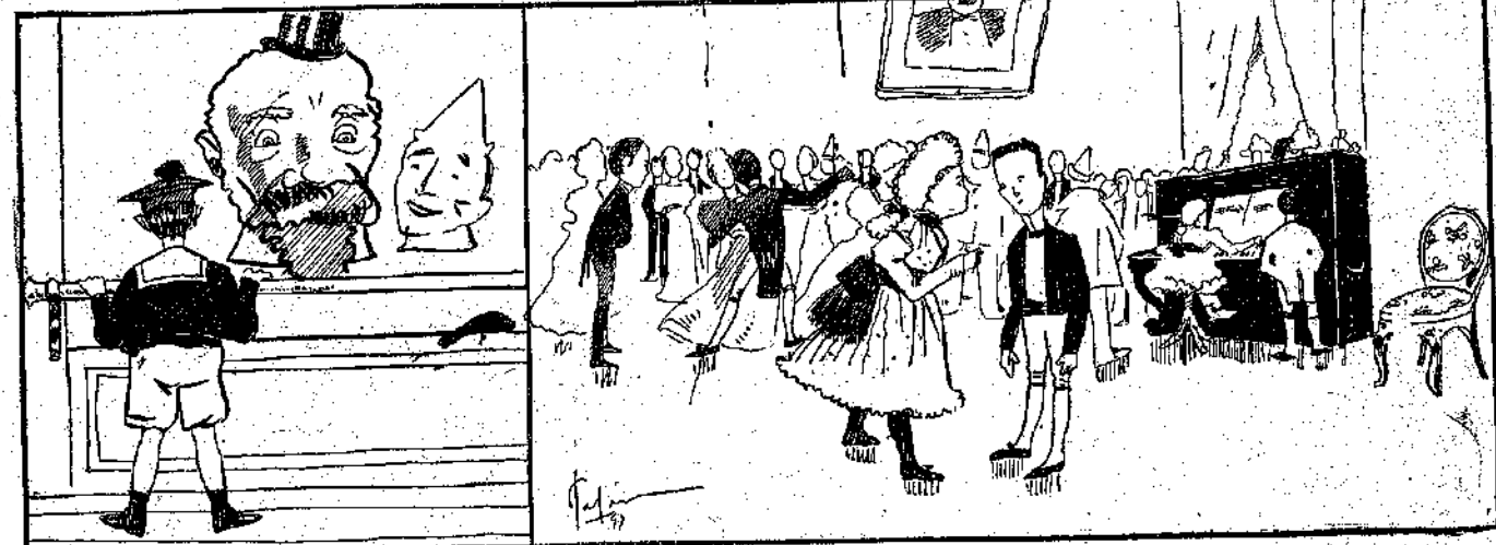
ΠΡΟ ΜΙΑΣ ΜΕΓΑΛΗΣ ΠΡΟΣΩΠΙΔΟΣ — Ω ! όλα κεφαλή και έγκέφαλον ούκ έχει !