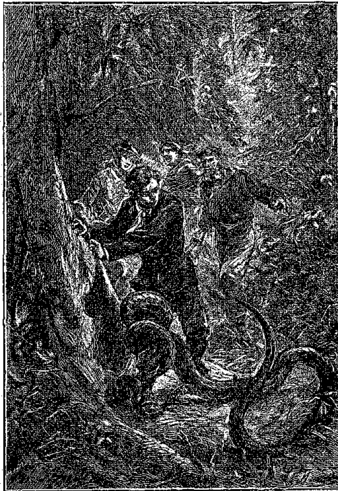
* Ἀλλὰ τὸ σῶμα τοῦ θηρίου, τὸ χονδρὸν ὡς ἡράκλειος βραχίων, περιετυλίχθη ἀμέσως περὶ τὸν πόδα τοῦ παιδίου. » (Σελ. 86, στίχ. α'.)

— Ὅπως ἀγαπᾶτε, κυρία Μαργαρόνα! ἀπήνησεν ὁ ναύτης, ὁ ὁποῖος δὲν ἐννοοῦσε νὰ χαλάσῃ τὸ χαιτῆρι τῆς καλῆς ὑπηρεσίας. Μποροῦμε ἐξαιρέτα νὰ περᾶσωμε ἐδῶ τὴν νύκτα. Ἀλλὰ πρὶν πλαγιάσωμε, εἶμαι τῆς ἰδέας νὰ μαζέψωμε ξεράδια καὶ νανάψωμε τὴ φωτιά τοῦ ὄλοι· ἢ κυρία Κοραλία. Μάλιστα ἐδῶ, καθὼς εἶνε ἔτσι φηλά, θὰ γίνῃ σω-