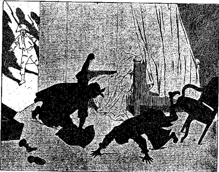
Ο Ραμιρέζ, γονυπετής, κατεγίνετο νά γρονθοκοπή άνηλεώς έν προσκεφάλαιον, έκλαμβάνων αυτό ως έχθρόν· ο δέ Παλουάζος...

— Τι θέλεις νά 'πής ; ήρώτησεν ο Ιππότης. — Θέλω νά 'πώ, απήντησεν ο Πεζοναύτης, πώς όμα φθάσωμε 'ς τώ Κάδιξ, εκεί δά είνε που πρέπει νά δέσουμε τής μούσες και νάνοιξουμε τώ φλέσι για τήν τρικυμία !