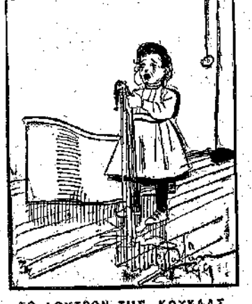
ΤΟ ΛΟΥΤΡΟΝ ΤΗΣ ΚΟΥΚΛΑΣ — Χῆ, χῆ, χῆ... πάει ἡ κουκλίτσα μου, ἔλωσε ὅλη!... πάει!...