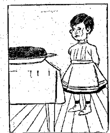
ΠΡΟ ΤΗΣ ΒΑΣΙΛΟΠΗΤΑΣ Ὁ Γιαννάκης σκέπτεται: «Ἄν μοῦ τὴν εἶδαν νὰ τὴν φάγω ὅλη ἐγώ, θὰ εὕρισκx χωρίς ἔλλο καὶ τὸ νόμισμα!»