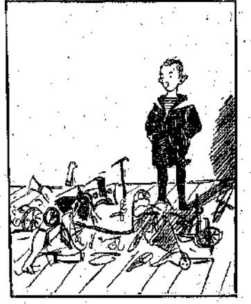
ΤΟ ΠΕΔΙΟΝ ΤΗΣ ΜΑΧΗΣ Πῶς κινήθησαν τὰ παιγνίδια τοῦ Τάκx μετὰ δεικαπέντε ἡμερῶν ἐνεργῶν ὑπηρεσιῶν. Φρίκη!