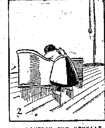
ΤΟ ΛΟΥΤΡΟΝ ΤΗΣ ΚΟΥΚΛΑΣ — Μὴν κλαῖς... κάθου ἀκόμη... λιγάκι ἀκόμη... δὲν κλαῖς.