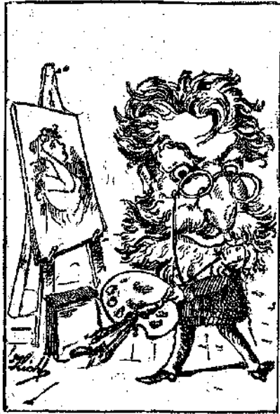
Βλέπετε αυτόν τον κωμικόν ζωγράφον; Προσπαθεί να μιμηθῆ τὸν μέγαν Ραφαήλον. Ποῦ εἶνε ὁ Ραφαήλος;