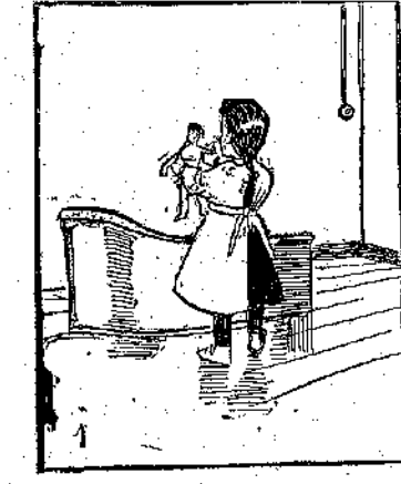
ΤΟ ΛΟΥΤΡΟΝ ΤΗΣ ΚΟΥΚΛΑΣ — Ἐλα νὰ σου κάμω ἑνα ζεστό μπάνιο, νὰ καθαρισθῆς, πουλάκι μου χρυσό.