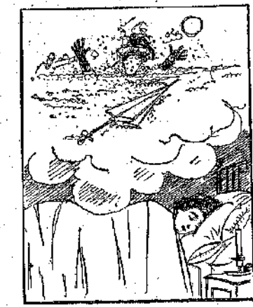
ΦΙΛΟΔΟΣΟΝ ΟΝΕΙΡΟΝ Κοιμηθῆναι καὶ ὀνειρεύεσθαι, δεῖ τόσα πολλὰ χερτάκια τῆς ριπιου εἰς τὴν ὄδον Ἐρμού, ὥστε κινδυνεύει νὰ πνιγῆ.