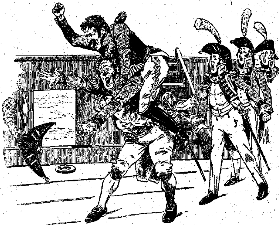
«Γαλλοὶ, φορήμι, παληάλογο! γκαλόπ, σοῦ λέγω!» (Σιλ. 54 στήλ. δ.)

ὡς καὶ πολλὰκις νὰ τοὺς ἀνατρέψῃ. Εἰς μάτην τῶ ἐπέβαλλον τὰς αὐστηρο- τέρας τιμωρίας· ὁ Πασίχαρος δὲν ἐνόου- σε νὰ φῆσῃ τὸ ἀστέφον του. Ἀκόμη καὶ τὴν νύκτα ἐκαθιλικεῖς τὴν αἰώραν του, ὡς νὰ ἦτο ἄλογον, καὶ ἐξεφώνιζεν ἕως τὸ πρῶτὰ τὰ προστάγματα, τὰ ἐν χρήσει εἰς τὸ ἱππικόν, μεθ' ὅλας τὰς ἐντόνους διαμαρτυρίας τῶν συντρόφων του, οἱ ὁ- ποῖοι δὲν ἠμποροῦσαν πλέον νὰ κλείσουν