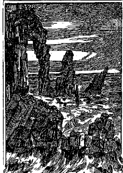
Ποϋ είναι ο άλιεύς των κοραλλίων; [Αί Μαγικά Εικόνες ύπάγονται εις τον Δια- γονισμόν των Δύσων των Πνευ- ματικών Άσκήσεων.]