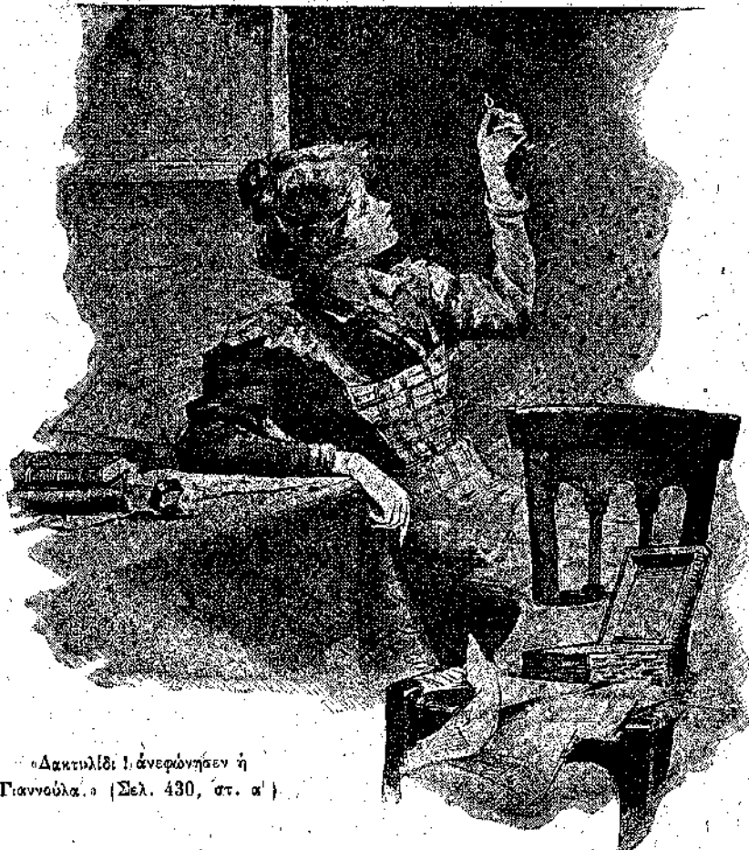
«Δακτυλίδι ! ἀνεφώνησεν ἡ Γιαννοῦλα.» (Σελ. 430, στ. α')

— Χμ ! κάτι ἄλλο θὰ εἶνε, εἶπεν ἡ μητέρα, ἀνυπομονοῦσα καὶ αὐτὴ, ὅσον ἡ