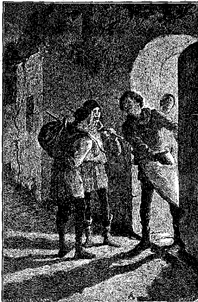
« Δὲν ἔχει πειὰ τόπο! πηγαίνετε ἄλλου! » (Σελ. 73, στήλ. γ'.)

Ἄλλ' ὁ πανδοχεὺς, εἰς τὸν ἔποσον δὲν ἤρρεσε διόλου αὐτῇ ἡ αὐθάδεια, ἔγινε κατα-