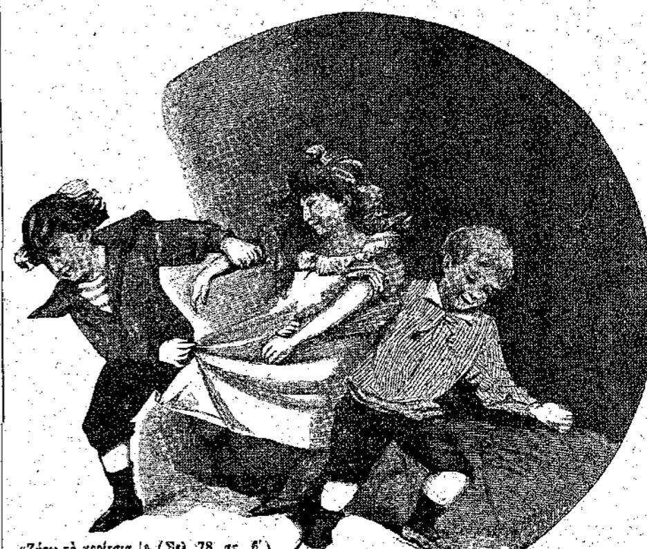
«Ζήτω τὰ κορίτσια !» (Σελ. 78, σελ. 6')

ΧΑΡΙΚΑΒΙΑ (ἐγειρομένη, ἐν ἀγανακτήσει). — Τί ; Ἡ φωνὴ πού εἶνε ἔστην κορυφῇ τῆς μηλιᾶς ;... (Πρὸς τὴν κοῦκλαν τῆς) Δὲν σοὺ τὸ ἔλεγα, Δὲρξ μου ; νὰ το !... Μ' αὐτὸ δὲν εἶνε πειὰ ἀνοησία, εἶνε πολὺ χειρότερον... αὐτὸ καταπᾶ σκληρότης ! Ἦθέλατε νὰ χωρίσετε τὰ καίμενα τὰ πουλάκια ἀπὸ τὴ μητέρα των ; ΤΑΚΗΣ. — Μ' αὐτὰ ἔχει ὁ πόλεμος... ΧΑΡΙΚΑΒΙΑ. — Ὁ πόλεμος ; Καὶ μήπως σὰς ἐκήρυξαν πόλεμον ; Ἐτσι, στα καλά καθούμενα, ἠθέλατε νὰ τοὺς κάματε τέτοιο-μεγάλον κακὸ ; ΤΑΚΗΣ (μετ' ὑποδωρότερον περιρρηνητικῶν). — Μὰ τί σοὺ εἶνε τὰ κορίτσια !... Ὅλο