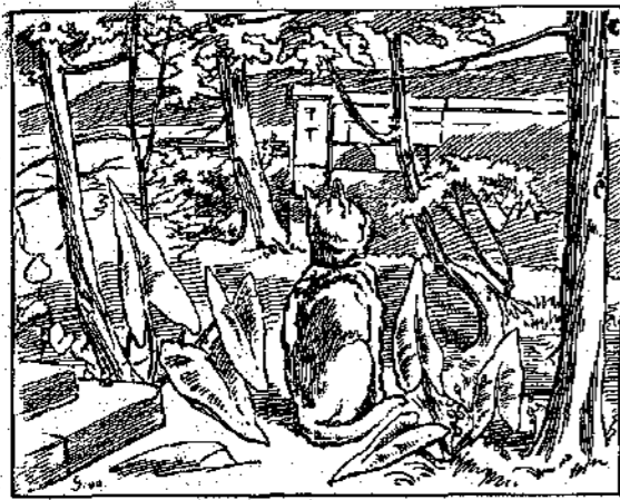
Η Φρίνα παραμονεύει... Πού είναι η λεία της;