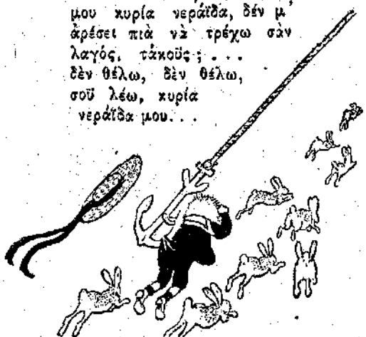
«Ἐτρέχε μὲ τὰ τέσσερα.»

— Ἐ! Ἐ! . . . μά, φτάνει πιά! τὰ πικουτσάκια μου ἐγίναν κουρέλι, πονοῦνε τὰ ποδάκια μου. Φτάνει, καλὴ μου κυρία νεράιδα, δὲν μ' ἀρέσει πιά νὰ τρέχω σὰν λαγός, τάκουε; . . . δὲν θέλω, δὲν θέλω, σοῦ λέω, κυρία νεράιδα μου. . .