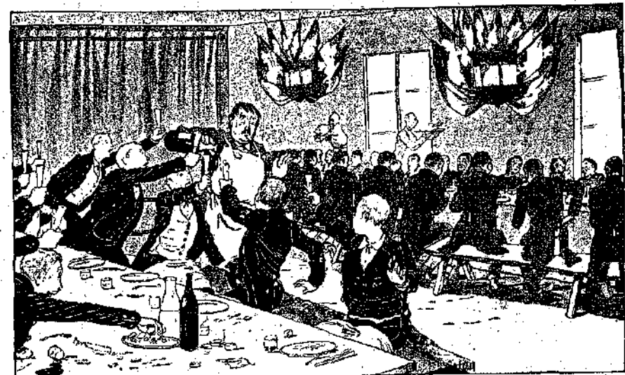
«Τὸ συμπέσιον διετέθη περίφημα.» (Σελ. 166, σελ. 6')