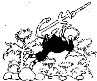
«Μπαρ! μιὰ πέτρα!»

τοῦ το κάμνει! Νὰ τους τώρα, πετᾷ σὰν πουλί, ψηλά στὸν ἀέρα, κοντὰ-κοντὰ στὰ σύννεφα! Οὐτε πέτρες νὰ του ματώνουν τὰ πόδια, οὔτε ἀγκάθια νὰ του τσαγγουρίζουν τὴ μύτη καὶ τὰ χέρια. Ἄχ! καὶ νὰ εἶχαμε τὴ χάρι σου, Πίπης! Καὶ ὅμως κάμνετε λάθος. Πάλιν ὁ Πίπης δὲν εἶνε εὐχαριστῆμένος. Δὲν εἶνε μάλιστα καθόλου εὐχαριστῆμένος, διότι