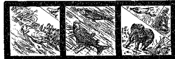
[Ἰδὲ σχετικὸν ἄρθρον εἰς τὴν ὀπισθεν σελίδα]

Ὅχι... ὁ διανομεὺς εἶχε φέρῃ μόνον τὴν ἐφημερίδα τοῦ σλαυϊκοῦ κόμματος, τὴν ὅποian ἔφερε κάθε βράδυ.