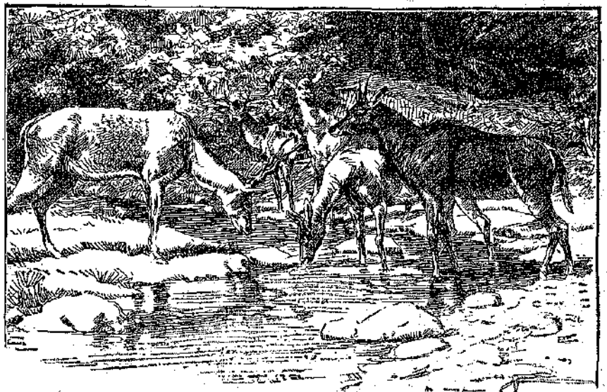
«Ἦσαν ἀντιλόποι, ἀγριοπρόβατα...» (Σελ. 19, στήλ. γ.)

Δὲν τὸ κατώρθωσεν. Ὅταν, ἀφοῦ ἐστάθμευσεν εἰς τὴν νῆσον τῆς Ἐνώσεως δέκα ἡμέρας, ὅσον δηλαδὴ ἐχρητάζετο διὰ ν' ἀνανεώσῃ τὰ τρέφιμα καὶ νὰ ἐπισκευάσῃ μαρικὰς ἀθαρίας, τὸ τρίστιον ἔκαμε πάλιν πανιά, — εὐρέθη διὰ γυκτὸς εἰς τὸ