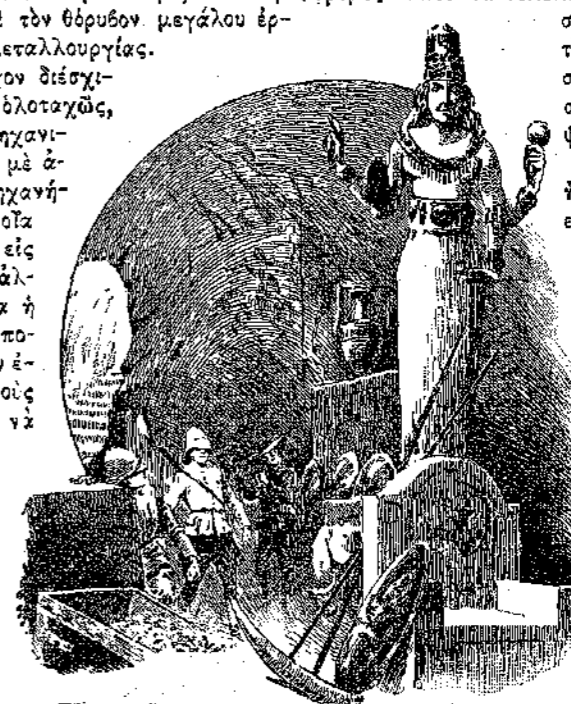
«Εἶνε σὰν ὄνειρο...» (Σελ. 340, στ. γ΄.)