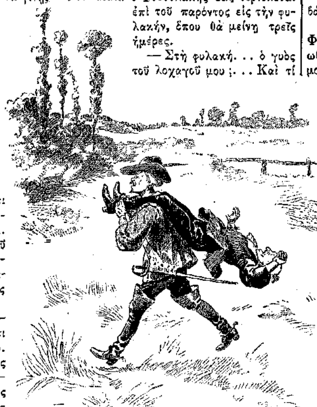
«Τὸν ἔκοψε ἔστην πλάτῃ του. . .» (Σελ. 337, στ. γ'.)

— Στὴ φυλακὴν. . . ὁ γυὸς τοῦ λοχαγοῦ μου; . . . Καὶ τί