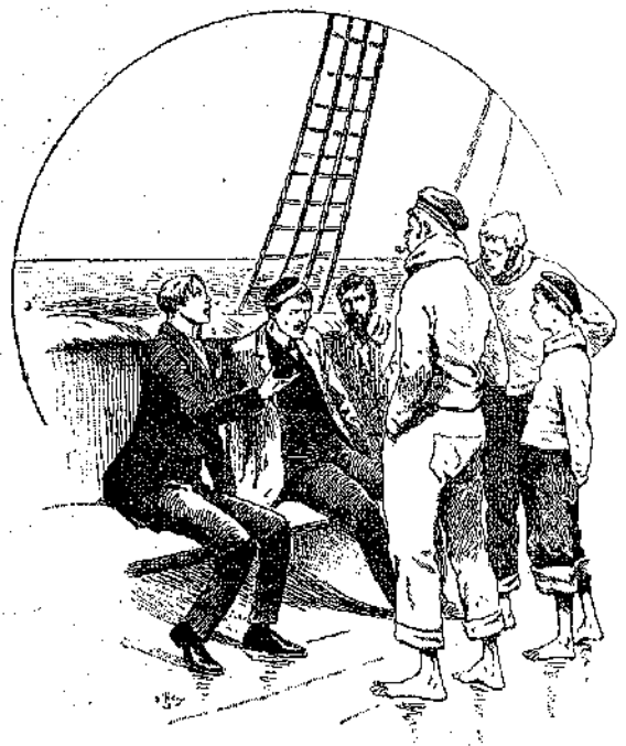
εεύρίσκονται επί του καταστρώματος τού πλοίου... (Σελ. 318, στ. α'.)

ζούν. Ζούν, και εις απόστασιν ένός τεταρτου μιλίου, εμφανίζεται έν ιστίον... Είναι μία μεγάλη γολέτα, ή όποία τρέχει πλησίον προς τό μέρος των.