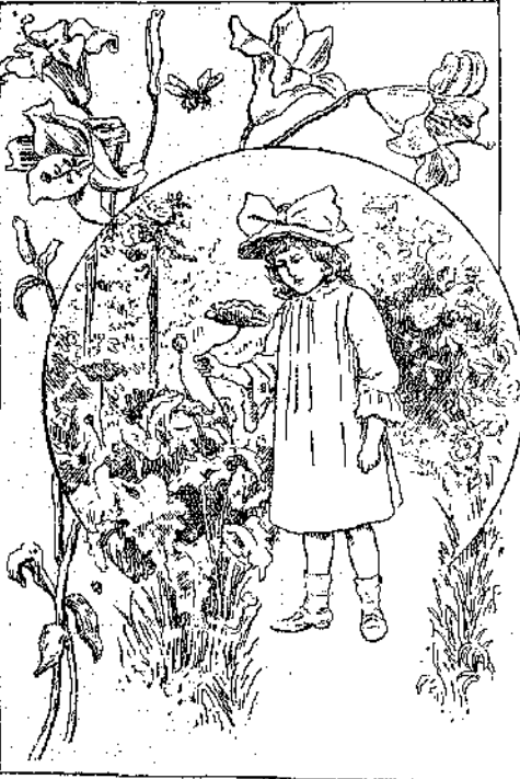
«—Μή! μή με κόβης!...» (Σελ. 325, στ. γ'.)

σε λίγο ή Μαρίκα στον κήπον υπάρχουν πολλά άλλα λουλούδια πού μπορώ να τά κόψω!