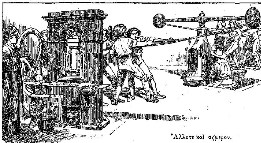
Ἄλλοτε καὶ σήμερον.