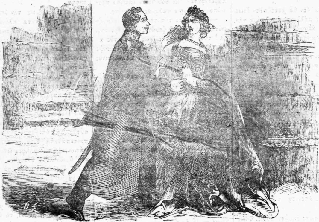
Αἰσχύνεσθε ἀναμνηστικῶς, ὅτι ἐσώθητε ὑπὸ ἀπλοῦ στρατῶτου. Σελ. 180, στήλ. 2.