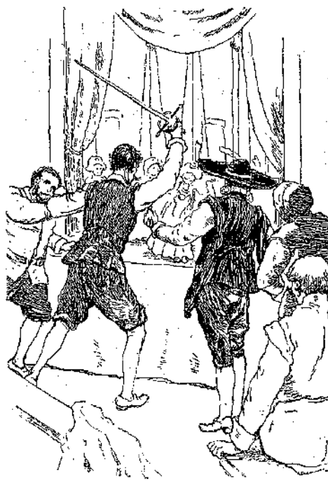
«Ποτέ!.. άνέκραζεν ό Δων Κιχώτης...»