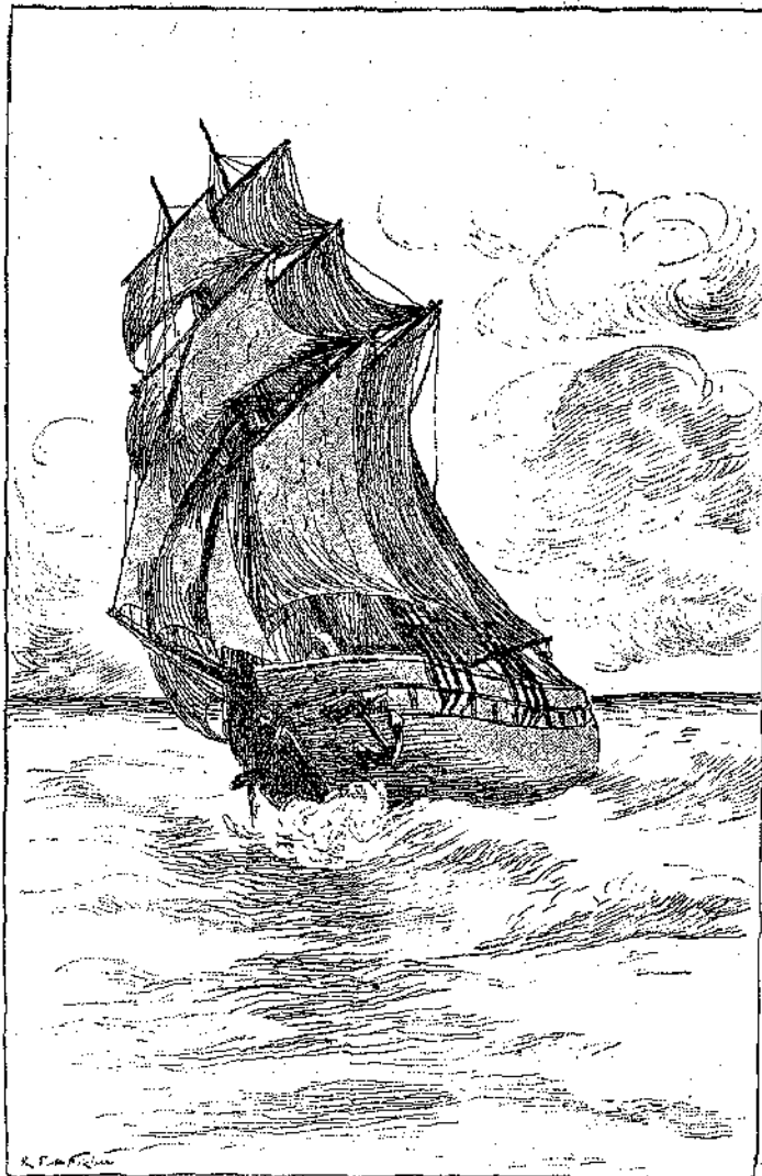
«Τὸ ιστιοφόρον εξηκολούθει τὸν άτακτὸν δρόμον του...»

— Άχ, εύχαριστῶ! έψιθύρισεν οὗτος με συγ-