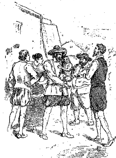
«Τοίς έφάνετο αληθινόν θαύμα...»