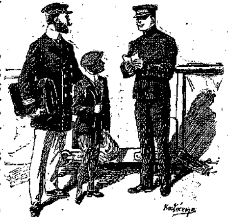
«Ἴδου τὸ παιδί, διὰ τὸ ὅποιον σὰς ὠμίλησα...»

Τότε οἱ ναῦται ἔπιασαν τὸ τραπέζι καὶ τὸ ἔσπρωξαν κατὰ μῆκος τῆς κουπαστῆς εἰς τὴν θύραν, ὥστε τὰ ἔμπροσθινά του πόδια νὰ προκαλέσουν μίαν τολάντωσησιν, μόλις θὰ ἔπαυον οἱ ἄνδρες νὰ τὸ κρατοῦν δυνατὰ ἀπὸ τὸ ἄλλο ἄκρον. Χωρὶς κρό-