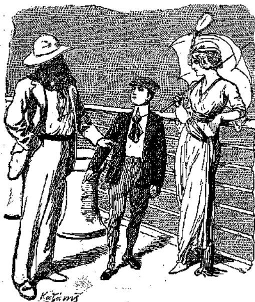
«Θὰ κάμω ὅ,τι θὰ ἔλαμα καὶ ἐπὶ Παρίσι. . .» (Σελ. 102, στ. β')