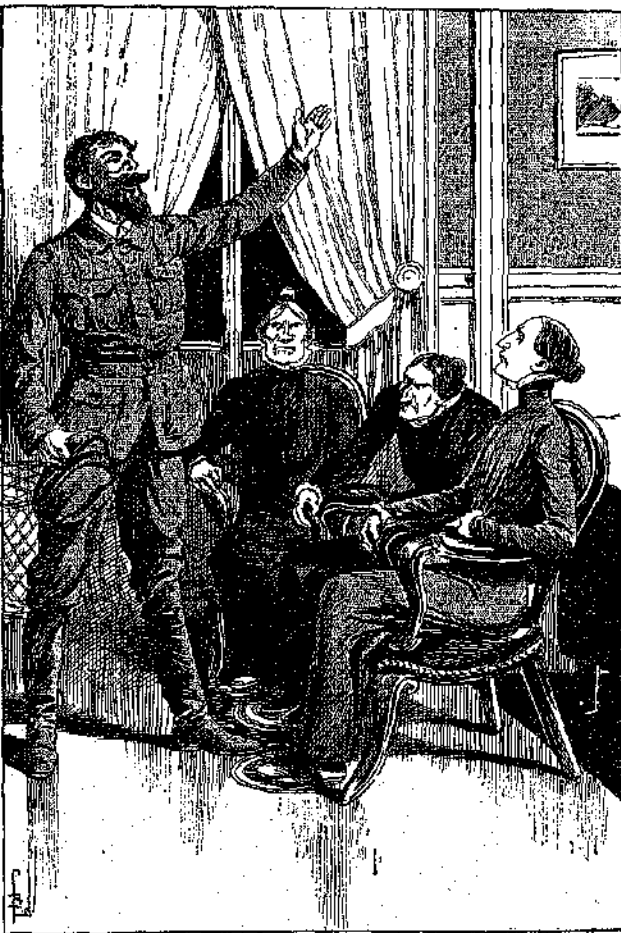
Ἐξῆσατέ με εἰς τὸ τέλος τοῦ μηνός! Θὰ μοῦ κάμπετε τὴν μεγαλύτεραν εὐεργεσίαν!... (Σελ. 29, στ. γ').

Ἐὰν ὁ Τορπέν ἐλογάριασεν, ὅτι οἱ λόγοι του αὐτοῦ θὰ ἔκαμναν ἐντύπωσιν, δὲν ἠκατήθη.