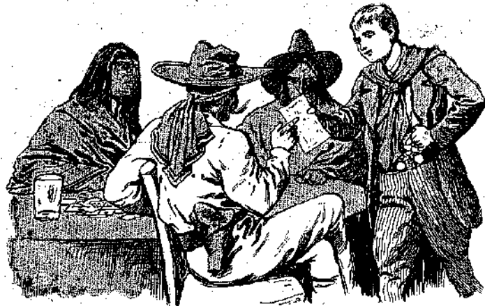
«Καὶ τὸ λαχεῖο; — Νά το! » (Σελ. 342, στ. α'.)

Δόν Κάρλος. Ἐμμεῖς σὲ εἶχαμε γιὰ σκωτωμένο. Ἐτηλεγραφήσαμε εἰς ὅλους τοὺς σταθμοὺς, γιὰ νὰ μάθωμε ἂν βρέθητε ποθεν, νὰ σῶμ' αὐτὸν, φαντάσου!... Ἐλα λοιπόν, πές μας! πῶς τὰ κατέφερες; τί ἀπέκαμες;