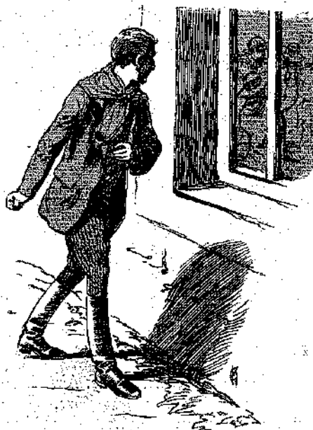
*Ὁ μικρὸς ἐκύτταξε μέσα ἀπὸ ἕνα παράθυρον τοῦ καφενεῖου..... (Σελ. 341, στ. α'.)