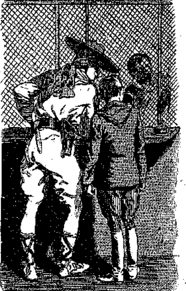
«Θά σὲ πληρώσω.» (Σελ. 342, στ. γ')