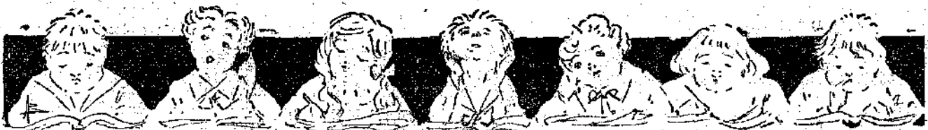
Γίσε τον Ό-δύον του