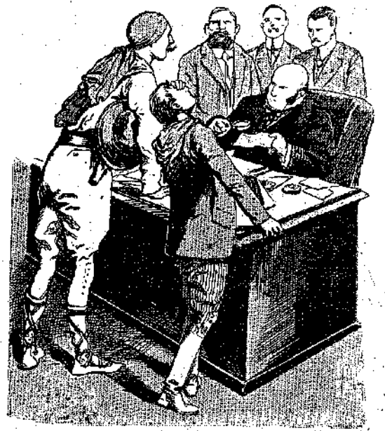
«Τὸ γραμματίον αὐτὸ εἶνε ψεύτικο!» (Σελ. 343, στ. α')