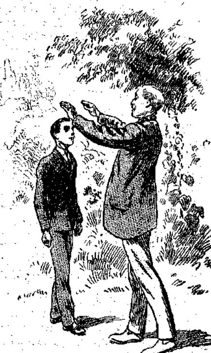
«Ναι, εἶμαι πρόθυμος νὰ σὲ βοηθῶ» (Σελ. 77, στ. β')

Ὅταν ἐγύρισε στὸ σπίτι, ὁ μικρός τὰ εἶπε ὅλα εἰς τὴ μητέρα του καὶ στὴν ἀδελφὴν του. Ἡ δὴ δύο γυναῖκες δὲν ἔβηκαν πιά τὸ θάρρος νάντισταθοῦν εἰς τὴν ἐπιθυμίαν του. Ἐνα μῆνα τώρα, εἶχον ὑποστῆ τόσα! Εἶχαν γνωρίσῃ ὅλες τῆς δυστυχίας, καὶ ὅλες τῆς ταπεινώσεις καὶ ὅλους τοὺς ἐξευτελισμούς: Εἰσβολές ἀστυνομικῶν εἰς τὸ σπίτι, ἔρευνες, ἀνακρίσεις, ἐπισκέψεις εἰς τὴ φυλακὴ. Ἡ Λουίζα, ποὺ ἦταν πάντα σοβαρὴ καὶ μελαγχολικὴ, εἶχε καταντῆσῃ τώρα τὸ ζωντανὸ ἀγαλμα τῆς Λύπης. Καὶ ἡ καιμένη ἢ κυρία Σομῶ, ἡ ἀγαθὴ μαμά, ἡ φανατικὴ ἀναγνώστριά τῶν ἐπιφυλλίδων, ὑπέφερε ἐπίσης πολὺ. — μαλονοῖται αὐτὴ εἶχε ἀπὸ μέσα τῆς κάποια εὐχαριστοῖς