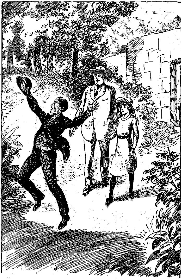
*Ἐλευθέρος!.. ἦταν ἐλευθέρος! (Σελ. 327, στ. 6')

— Γρήγορα! γρήγορα! ἐφώναξε ὁ Ἐρρίκος. Μόλις προφθάνω νὰ κάμω τὴν ἀλλαγὴ μου!... Κ' ἐπράσθεσε, μὲ τὸ φαῖδρον πάντα ὑπὸς ἓνος Γαβροῦ: — Ἀρχίζομε!... Ἐμπρός!... Στὴ σκηνὴ ὁποιος ἔχει μέρος στὴν πρώτη πρῶξι! Ἀμέσως ὁ γιαντῶς ξανάβαλε τοὺς ἐπίδεσμοὺς στὰ μπράτσα τοῦ παιδιοῦ. Συγχρόνως ὁ Ἀλδαράδο, θέλων νὰ παρευρεθῇ στὴν κωμωδίαν καὶ νὰ γνωρίσῃ τὸν τρομερὸ κακούργον, ἐφόρεσε γρήγορα τὴν ἀσπρὴν μπλοῦζαν ἓνος νοσοκόμου. — Ἔτσι! ἔλεγε, προτείνων ἀπειλητικῶς τοὺς ταραστῖους γέβους του (*) κ' ἂν κατὰ τύχην, ἐ φίλος καταλάβῃ τὴν κατεργαρίαν, θὰ εἶμαι παρών, γιὰ νὰ... τοῦ τὴν ἐξηγήσω! Καὶ καθαρώτατα μάλιστα! Ἐνα κευδούνησμα, στὸ διάδρομον, εἰδοποίησε τὸν γιαντῶ, ὅτι τὸ αυτοκίνητο κοῦ εἶχε ἴδῃ ὁ σκοπὸς, σταμάτησε μπροστὰ στὴν καγγελόθυρα. Ὁ ψευδο-θυρωρὸς ἔλαβε τῆς ἀναγκαῖες ὁδηγίης, ἐνῶ ἔπάνω ἀποτελείωναν γρήγορα τῆς ἐτοιμασίης των. Ὁ Ἐρρίκος ξαπλώθηκε πάλι στὸ κρεβάτι. Ὁ γιαντῶς ἐπῆρε ἀπὸ ἓνα ἐρμάρι ἓνα ἐργαλεῖον καὶ ξαναπάγωσε τὸ πρόσωπο, τὰ χέρια καὶ τὰ πόδια τοῦ ψευτονεκροῦ μὲ χλωροφόρον ἐθόλιον. Κ' ἀφοῦ ἐρριξε ἓνα βλέμμα ὀλόγυρα, γιὰ νὰ βεβαιωθῆ ὅτι δὲν ἐξέλασε τίποτα, ἐπῆγε στὸ γραφεῖον κοῦ, καθὼς εἶπαμε, ἦταν στὸν ἴδιον διάδρομον, λίγες πόρτες παρακάτω. Ἦστερ' ἀπὸ πέντε λεπτά, μπῆκε ἐκεῖ—μέσα ὁ Ἀγκλάς καὶ ἡ Πεπίτα.