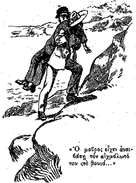
«Ὁ μαυρὸς εἶχεν ἀναβῆσαι τὸν αἰχμάλωτό του στὸ βουνό...»