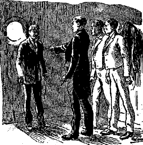
«Κύτταξτε ὁμοῦ μὴ μᾶς προδώσῃ!.. (Σελ. 375, στ. α΄.)

«Γιατί με συνέλαβαν;.. Ἐκεῖνος ὁ καταραμένος ὁ Βραζιλιανός, τῶλανε βέβαια... Φοβήθηκε μὴ τοῦ πάρω τὴν Κολέττα καὶ, σὰν ἀγριάνθρωπος ποῦ εἶνε, μ' αἰχμαλωτίσει, γιὰ νὰ με ἀναγκάσῃ» (*) Ἰδὲ εἰκόνα προηγ. φύλ. σελ. 365