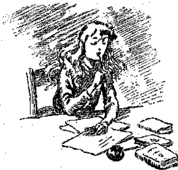
«Ἡ Κολέττα μελετᾷ...» (Σελ. 38 στ. α')