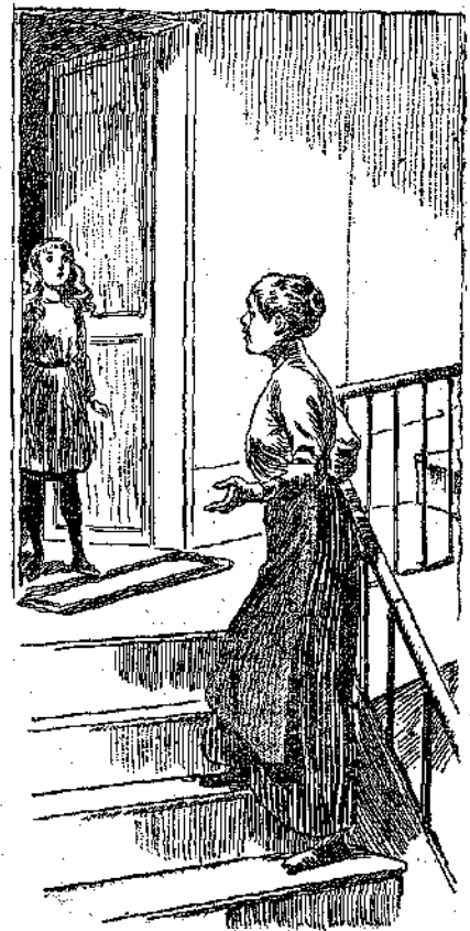
«Ἔτσι λοιπὸν μελετᾷ, κυρία Κολέττα...»

— Ἀφίστε ἤσυχο τὸ παιδί, εἶπε δὲν μάγαπᾷ ἀκόμη καὶ εἶνε πολὺ φυσικὸ