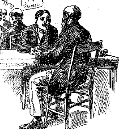
Επιτέλους έπιανε γνωριμία με τον Σομώ...

Η κλη γοναίκα έκαμε μορφασμό οίκτου, έπιανε φιλικά την Κο-