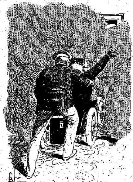
«Ἐσπρωξε τὴν πολυθρόναν πρὸς τὴν θύραν» (Σελ. 87, στ. α')

— Τὴν ἀνόητος ποῦ εἰμαι! ἔλεγε καθ' ἑαυτόν, δαγκάνων τοὺς γρόνθους του ὅταν εἶνε κανένας σακάτης, δὲν ἐπιχειρεῖ τέτοια πράγματα καὶ δὲν πᾶει γυροῦντας περὶ πειρασ. Ἐνόμιζα, ὅτι τὰ χρήματα ἤμποροῦσαν νάντικαταστήσουν τὰ πάντα, ἀκόμη καὶ τὰ πόδια ποῦ μοῦ λείπουν καὶ ἔμωσ νά, αὐτὰ τὰ χρήματα εἶνε ἡ αἰτία τῆς καταστροφῆς μας... Καὶ ὁ Λουλού μου; ὦ Θεέ μου, ποῦ εἶνε ὁ Λουλού μου;