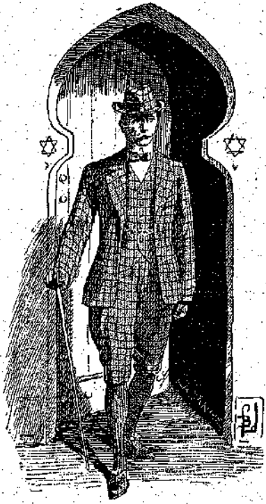
«Ἡ βροστὰ ὕδρα ἠνοιχθη...» (Σελ. 222, στ. 6')

— Καὶ βέβαια ἐξοχα! δὲλαθεν ὁ σπουδαστής, ὑπερήφανος — καὶ μετ' ὀλίγου τοῦ — διὰ τὸ κατέρθωμα.