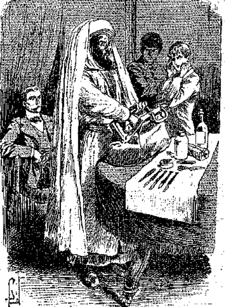
«Ο Ιατρός άδειάζεν επάνω εις τό τραπέζι ένα σάκκον...»

— Άκριβώς! απεκρίθη ο κ. Δίκ. Το παιδί έχει καλύτερη μνήμη από σένα, Τζούλη. Ένθυμείται ότι τρεις ήμέρας πρό του τέλους του μηνός, εάν δέν ελάμβανα άπάντησιν από τον κ. Ρισανέλ, θά ήμουν υποχρεωμένος διά να τού υπενθυμίσω τό χρέος του και να τού δείξω ότι δέν έχει να κάμη με κανένα κούνον έκβιαστήν, να τού στείλω, με μεγάλην μου λύτην και με ειδικόν ταχυδρόμον, τ' αυτιά του υιού του.