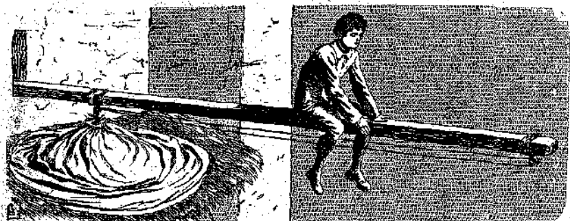
«Ἰδὲ τὸν φίλον τοῦ καθήμενον ἐπὶ τῆς δοκοῦ, ὑπεράνω τῆς ἀβύσσου!» (Σελ. 221, στ. 6')