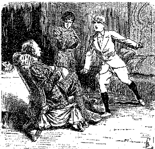
«Θά μου κόψετε λοιπόν τώρα ταυτιά...» (Σελ. 223, στ. α')

Έπειτα, δείχνων την άκρην του σχολιού, την οποίαν έκρυψεν όπισω από την θύραν του δωματίου του, προσέθεσε. — Μ' αυτό το σπαγάκι, κατακτώ έγω τον Κατακτητή!