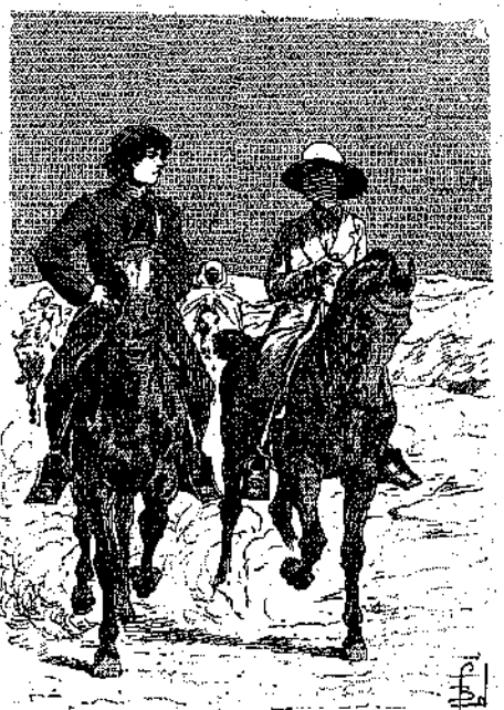
«Ἐίλω νὰ βεῖω νὰ τὰ βγάλω πέρα» (Σελ. 263, στ. α')

Ἐίχεν ἐξαντληθῆ πλέον ἀπὸ τοὺς κόπους, τὰς συγχινήσεις καὶ τὴν πείναν.