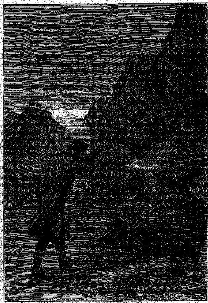
«Μια σφαίρα τον βρούκε στη μέση των δύο ματιών...» (Σελ. 318 στ. 6.)

Από το ύψωμα, όπου ο Νάβ κι' ο Πέγκροφ έστρωσαν το πρόγευμα, το βλέμμα έφθανε μακριά, γιατί ο καιρός ήταν ωραίος κ' η άτμοσφαιρα καθαρή. Αλλά κανένα πανί δεν φαίνεται στον ορίζοντα. Σ' όλη εκείνη την ακρογιαλιά, πουθενά, κανένα καράβι, ούτε καν συντριμμι καραβιού, λείψανον ναυαγίου. Ας είνε γι' αυτό θα έβεβαιώνοντο καλύτερα, όμω, έξερευνού-