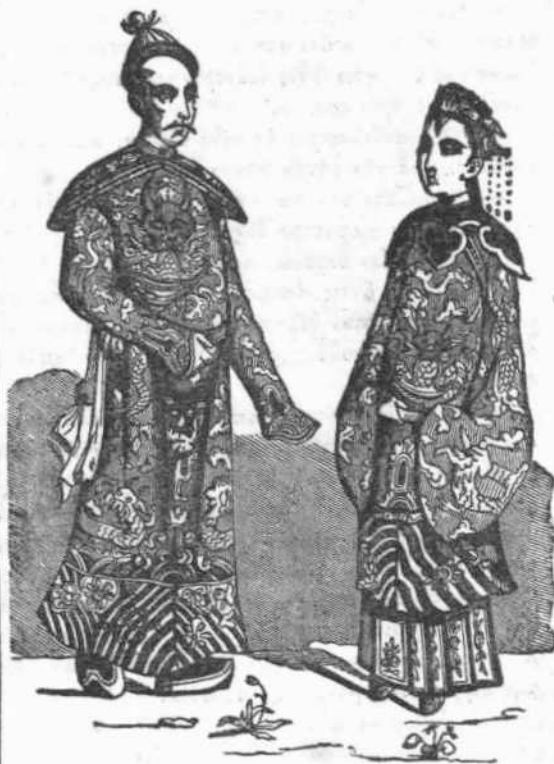
Μαρδαριος μετά της συζύγου αυτού.

Οι Κινεζοι, ως γνωστόν, εισι Μόγγολοι την καταγωγην, έθνος ήμερον και γεωργικόν, ασκούν τας χρησίμους τέχνας και τας επιστήμας, μάλιστα δε την κατ' αυτούς υπερτάτην των επιστημών, την καλλιγραφίαν, αυξόμενον δε και πληθυνόμενον κατά την εντολήν και υπέρ αυτην, ώστε, μη έπαρκούσης της απεράντου αυτης γης, κατοικει πλωταις πόλεσι και αυτοις τους εύρεις ποταμούς του, νομιζόμενον δε ευδαιμονίαν της υλικής εκείνης ουδ' επεθύμει ουδ' έφαντάζετο.