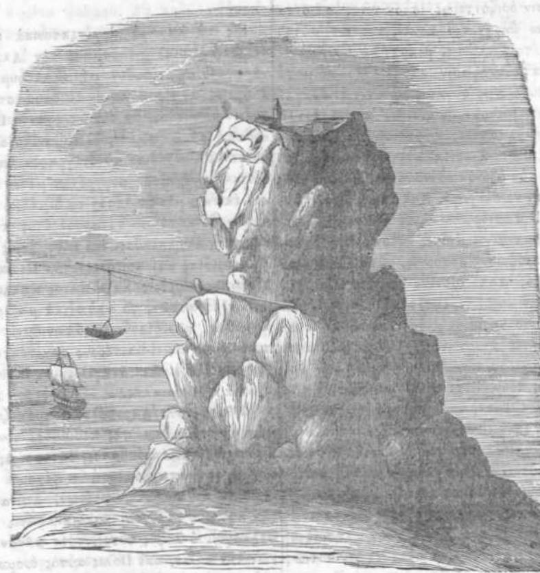
Παναγία ἢ Καλόγηρος νήσος.

ὑπερβαίνει τῶν παρακειμένων νήσων, ὡς ὑψικόμενος τις κνύουσι τρανώτατα ὅτι ἄλλοτε ἡ γῆ αὕτη οὐδόλως ὑπῆρξεν ἀμοιρος κατοίκων. Ἄλλὰ τίνες ἦσαν οὗτοι; Ἦσαν τάχα αἰμοχαρεῖς πειραταὶ ἀποκατασταθέντες ἐν τῇ ἀκρωρείᾳ ταύτῃ, ὅπως εὐχερέστερον ἀνακαλύπτωσι τὰ διαπλέοντα πλοῖα, καὶ ἀσφαλέστερον κακοῦργῶσιν; ἦσαν βδελυροὶ τινες κακοῦργοι καταδιωκόμενοι ὑπὸ τῆς πολιτείας, καὶ ἐλθόντες εἰς τὸ ἀπρόσιτον τοῦτο μέρος ἵνα διαφύγῃ τὴν δικαίαν τῶν νόμων ὀργήν; ἢ μὴ ἦσαν ἐκ τῶν ἀρχαίων ἐκείνων θυμαγωγῶν τῶν ἐπὶ τῆς ἀστάτου τοῦ παλιμκατὰ διαφορῶν ἀποστάσεις καὶ ὑπὸ μυρίας μορφᾶς, ἐν μέσῳ διαυγῶν ὑδάτων γαληνοτάτου πελάγους, ὡς εἶτ' ἀδίκου ἀποράσεως αὐτοῦ τούτου ἐνταῦθα ἐξορι-