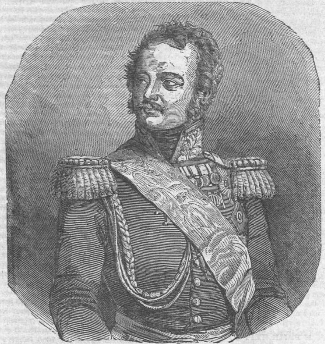
Ἰωάννης Θεοδορίδης Πάσκεβιτς.

τείχη τῶν Παρισίων. Μετὰ δὲ τὴν εἰρήνην ἐπέστρεψεν εἰς τὴν πατρίδα του. Ἐπανελθόντος τοῦ Ναπολέοντος ἐκ τῆς Ἑλλάδος, ἐπανῆλθε καὶ αὐτὸς μετὰ τῆς μοίρας του εἰς Γαλλίαν, καὶ εἰς ἀμοιβὴν τῶν κατὰ τὴν βραχυχρόνιον ταύτην ἐκστρατείαν ὑπηρεσιῶν του, ἐδόθη πρὸς αὐτὸν ἢ διοικητικὴ τοῦ σώματος τῶν γρε- ρήνην ἐπωφελεστάτην. Ἀντὶ δὲ τῶν ὑπηρεσιῶν του αὐτῶν ὁ αὐτοκράτωρ τὸν ὠνόμασε κόμην Ἐριβάν, ἐπιδαφιεύσας συγχρόνως αὐτῷ καὶ ἐν ἑκατομμύριον ρουβλίων χαρτίνων. Μόλις ἐπέστρεψεν εἰς Τίφλιδα, καὶ ἐξεβράγη ὁ μετὰ τῆς Τουρκίας πόλεμος τοῦ 1828 ἔτους. Ὁ Πάσκεβιτς ἐξεστράτευσεν τότε εἰς Κάρς,