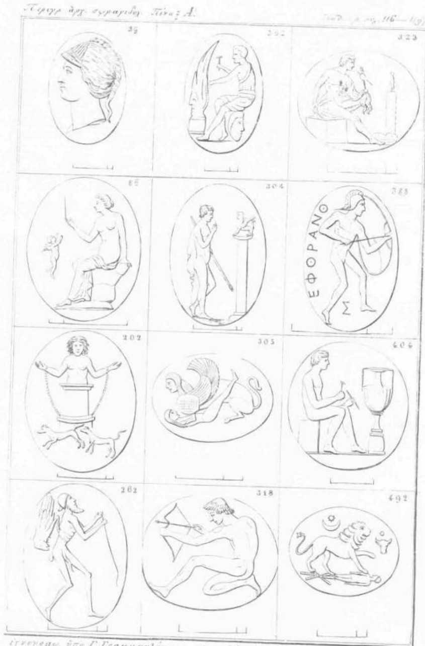
επιγραφή από Γ. Γραμματιάνου υπ. από Α. Λαφόρη εν Αθήναις

τος μύδιον, και Ίσιδος φορούσης τὸν συνήθη κόσμον, ὡς ἀπαντᾷται ἐπὶ Πτολεμαϊκῶν νομισμάτων. ἐπ. Ζ. τάξ. ε'. μ. 12. πλ. 11. λίθος σμάραγδος, κυρτός, τοῦ Κ. Ν. Δραγούμη.