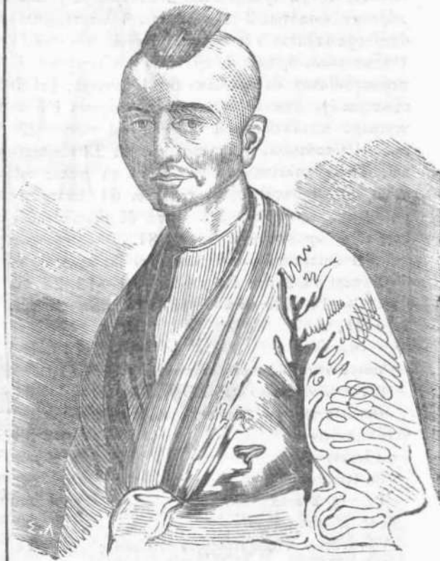
Β'. Βασιλεὺς Σιάμης.

Ἴδου καὶ ἡ περιγραφή τῆς ὑποδοχῆς· ὁ γράψας αὐτὴν ἦτο ἐκ τῶν συνοδευσάντων τὸν διαπραγμα-