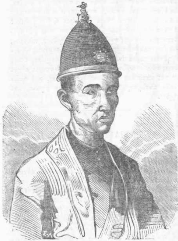
Α'. Βασιλεὺς Σιάμης.

ἐν Σιάμη, καὶ νὰ διευθύνῃ τὰς τύχας τοῦ μεμκροσμένου ἐκείνου Κράτους. Κατὰ προτροπὴν αὐτοῦ ὁ βασιλεὺς τῆς Σιάμης, ἀπέστειλε πρεσβείαν πρὸς Λουδοβίκον τὸν ΙΑ' τῆς Γαλλίας, διαπραγματευθεῖσιν καὶ ἐν Ἀγγλίᾳ ἐμπορικὴν συνθήκην μετὰ Ἰακώβου τοῦ Β'. Τὸ 1683 καὶ 1687 ἀνταπέστειλε καὶ ὁ βασιλεὺς τῆς Γαλλίας δύο πρεσβείας πρὸς τὸν συνάδελφόν του τῆς Σιάμης, ὡς καὶ στόλον μετὰ πέντε χιλιάδων στρατιωτῶν· τὰ δύο κυριώτερα φρούρια παρεδόθησαν εἰς τούτους, καὶ παρ' ὀλίγον τὸ βασίλειον ἐκεῖνο νὰ γίνῃ ἐπαρχία Γαλλικὴ. Ἄλλ' αἱ καταχρήσεις τῶν ξένων στρατιωτῶν ἐγέννησαν ἐπανάστασιν καθ' ἣν ἐρονεύθη καὶ ὁ Ἕλληνας ὑπουργὸς π (β).