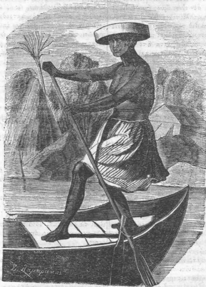
Γυνὴ ἐλαύρουσα λίμβορ.

και ξύλου. Περιεκυκλούμεθα δὲ ὑπὸ σμήνου περιέργων οἵτινες παρέρχονται τὸ ἐνδομα ἡμῶν και ἡτέριον ἡμῶν πανταχόθεν. Πάντες δὲ οὗτοι μόλις ἐκαλύπτοντο διὰ μελαινῶν χιτῶνων, και ἵσταντο ἢ μὲν ἀνωθεν τῶν κεφαλῶν οἱ δὲ πολὺ κατώτερον ἡμῶν. Ἐνίοτε διακρίνοντες ὑπὸ θύρας φυσικῆς, εἰσερχόμεθα εἰς εὐρυχωροτάτας αἰθούσας ἐκ μαρμάρου, ὠρκίζομενας πάντοτε ὑπὸ φυτῶν ἀνθρώπων και δένδρων ἀειθαλῶν. Ἐπαγωγότερον ὅμως πάντων τῶν θεαμάτων ὑπῆρξε τὸ ἐρεξίης: