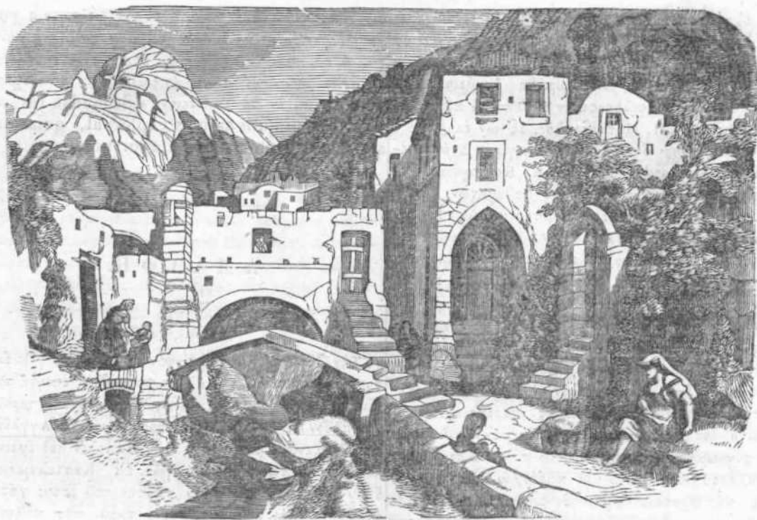
Ἀμάλφη. Κουλάς τῶν μύλων.

λασαν καμάρχι ὑπερκαπίζονται τὰς ἀλιὰδας κατὰ τῶν ἐκμαινομένων κυμάτων. Ἡ μητρόπολις, στηριζομένη ἀπὸ ὠραιότατους κίονας, ἀνυψοῦται περίλευκος ὑπὲρ τὰ γλαυκὰ ὕδατα τῆς μεσογείου θαλάσσης, καὶ φαίνεται ὡς λείψανον τῆς πάλαι δημοκρατίας, ἣτις εἶχεν ἀποκτήσει τόσην ἰσχύϊν διὰ τῆς ἐμπορίας καὶ τῶν ὀπλῶν. Εἰς τὴν Ἀμάλφην αὐτὴν, ἀγνωστον σχεδὸν γωνίαν τῆς σημερινῆς Ἰταλίας, ἀνεφάνησαν ἥρωες καὶ σοφοὶ ἐρίσαντες πρὸς τὰς πλησιοχώρους δημοκρατίας ὑπὲρ τῆς θαλασσοκρατορίας. Εἰς τῶν ναυτῶν αὐτῆς, ὁ Φλάβιος Ἰζιδόριος, εὐηργέτης τὴν ἀνθρωπότητα ἐρευνῶν τὴν ναυτικὴν πυξίδα ἦτις, ὡς ἀπεδείχθη μετέπειτα, ἦτον ἐκπαιδευμένη εἰς τὴν Κίνα, καὶ εἰς τοὺς βράχους τῆς Ἀμάλφης ἀνευρέθησαν οἱ Παρδέκται . Τὸ περιώμιον τοῦτο χειρόγραφον, τὸ ὁποῖον παρέλαβον οἱ Πισάται κατὰ τὴν ἐν 1135 πολιορκίαν τῆς Ἀμάλφης, μόνον τῇ ἀδείᾳ τῆς ἐξουσίας καὶ ἐν καιρῷ νυκτός ἐδείκνυτο ἐπὶ τῆς δημοκρατίας. Μετὰ ταῦτα ὁμοῦς ἐγένετο γνωστὸν ὅτι καὶ ἄλλα ἀντίγραφα τῶν Παρδέκτων ἐτώζοντο, καὶ σήμερον εἰς τὴν Φλωρεντιανὴν δὲν δυσκολεύεται νὰ παρατηρήσῃς ὅσον θέλεις ἐν καιρῷ ἡμέρας τὸ ἐν τῇ Λαυρεντιανῇ βιβλιοθήκῃ. Τῆς Ἀμάλφης τέκνον ἦτο καὶ ὁ Μιχαήλ, ὁ ἡμερήσιος ἐκεῖνος βασιλεὺς, ὁ ὅστις τὴν τελευταίαν τῆς ἐλευθερίας φωνὴν κατὰ τῶν ξέων δεσποτῶν τῆς Ἰταλίας. Ἀλλ' ἐπέσε, καὶ ἐπέσαν οἰκτρῶς ἡ πόλις αὕτη μετὰ τεσσάρων ἑκατονταετηρίδων ἀκμῆς, καὶ μόλις ἀμυθεῖς τινες μοναχοὶ καὶ ἀμυθεστεροὶ ἀλιεῖς κατοικοῦσιν εἰς τὰς Ἰταλικὰς ταύτας Ἀθήνας τοῦ μεσαιῶνος. Εἰς τὴν παρ' αὐτὴν κώμην Ἀτρινὴν σώζεται περιεργότα-