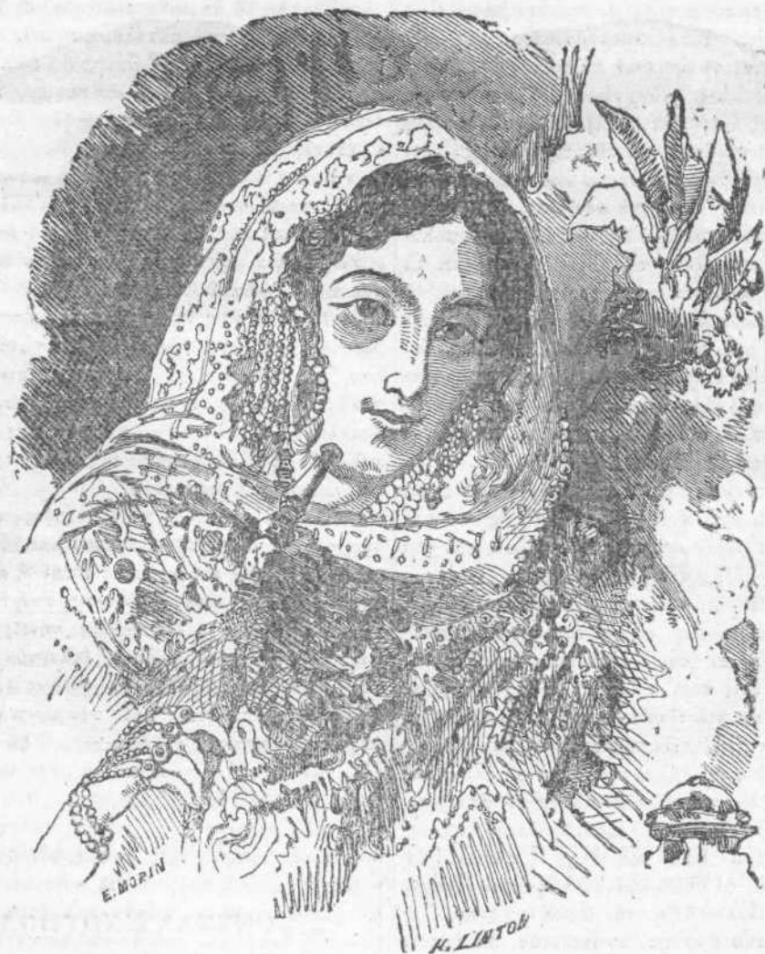
Ἡ βασίλισσα τῆς Οὐθῆς.

σπετε γονεῖς γενηρακότας ἢ χήρας καὶ δυστυχεῖς μητέρας, καὶ ἄλλαι διασπειρόμεναι ἐντὸς καὶ ἐκτὸς τῆς Ἑλλάδος ν' ἀρσιωθῆτε εἰς τὸ δύσκολον μὲν ἀλλ' ἐθνωφελέστατον ἔργον τῆς ἠθικῆς διαπλάσεως καὶ διανοητικῆς ἐκπαιδεύσεως τοῦ φύλου εἰς τὸ ὁποῖον ἀνήκετε.