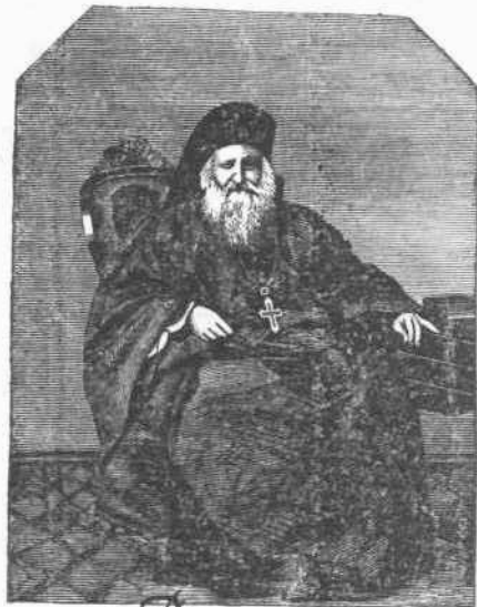
Ὁ ἁγ. πατριάρχης Κύριλλος Β΄

Περὶ τῆς φιλογενείας τοῦ μακαριωτάτου πατριάρχου Ἱεροσολύμων καὶ πάσης Παλαιστίνης Κ. Κυρίλλου τοῦ Β΄, καὶ τῆς ἐνθέρμου καὶ ἐνευδότου προστασίας ἣν χορηγεῖ εἰς τὰ καλὰ, δις καὶ τρίς ἔγραψεν ἡ Παρδώρα οἱ δὲ ἀναγνώσται αὐτῆς ἐνθυμοῦνται πρὸ πάντων ὅτι ὁ φιλόμουσος αὐτὸς πατριάρχης ἰδρύσατο σχολεῖα ἀρρένων τε καὶ θηλέων ἐν Ἱεροσολύμοις, συνέστησεν ἐκεῖ πλουσιώτατον τυπογραφεῖον, ἐξέδοτο πολλὰ καὶ ἀξιόλογα συγγράμματα, ἐξ ὧν καὶ τινὰ ἦσαν ἀνέκδοτα, καὶ ἐπιδαψιλεύων χρηματικὰς χορηγίας πρὸς πολλοὺς μὴ ἔχοντας εἰσέτι τοὺς ὀφθαλμοὺς ἀνοικτούς εἰς τὸ φῶς τῆς παιδείας, ἀναγκάζει οὕτω αὐτοὺς νὰ στέλλωσιν εἰς τὰ σχολεῖα τὰ τέκνα αὐτῶν. Ὁ φιλόμουσος οὗτος ἱεράρχης ἐδώρησατο πρὸ τινων μηνῶν καὶ πρὸς τὴν Φιλεκαπαιδευτικὴν Ἐταιρίαν ἀριθμὸν τινὰ ἐκκλησιαστικῶν βιβλίων, ἐσχάτως δὲ καὶ σταυρὸν παλῦτιμον μετὰ τιμίου ξύλου καὶ ἀρτοπόριον.