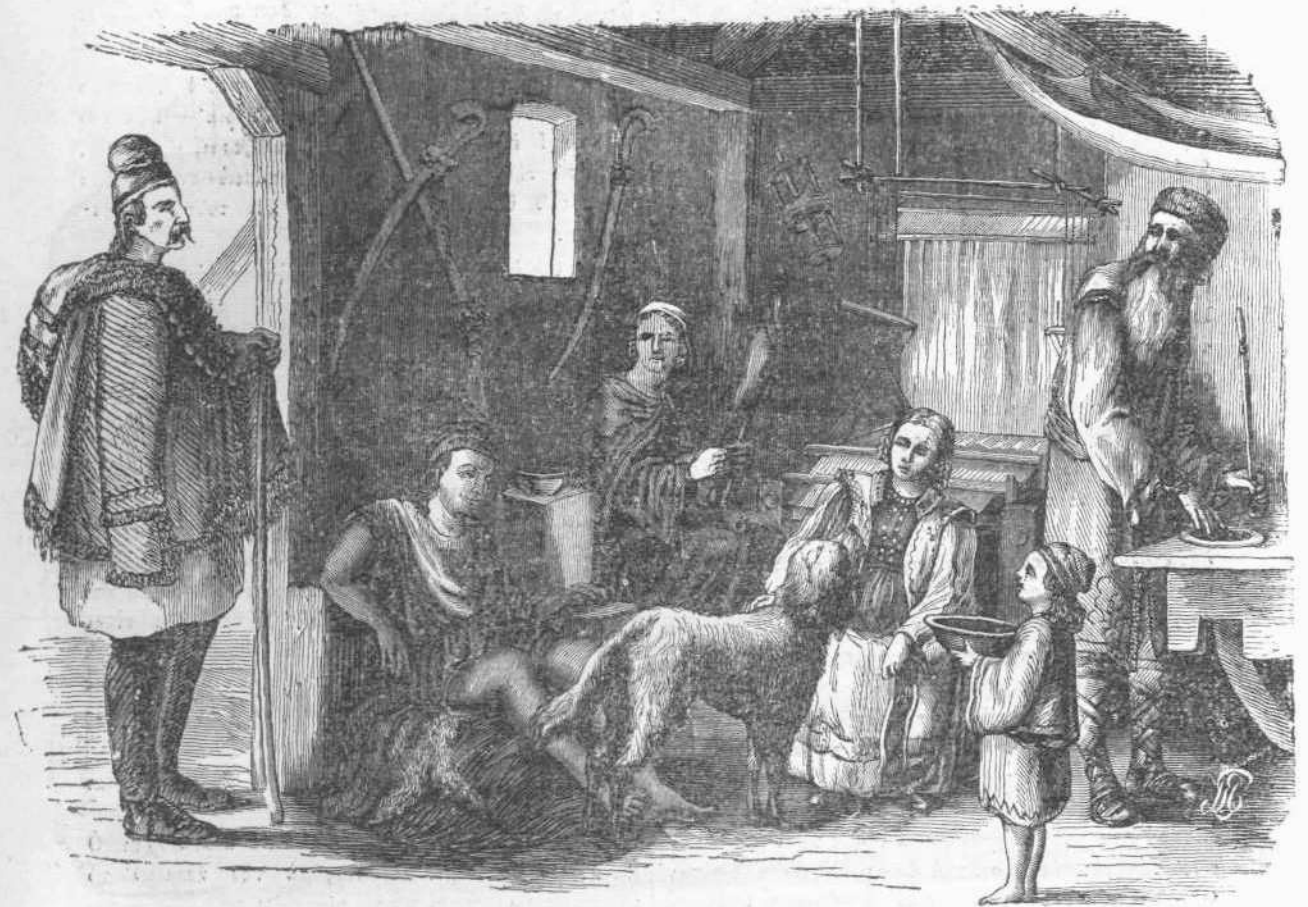
Ἐσωτερικὸν οἶκιον Σερβικῆς. (σελ. 258.)

καὶ ἀξιεράστου Ἐ... Ὁ μὲν βίος του, ἀφιερωθεὶς ὅλως εἰς τὴν μελέτην, ὑπῆρξεν εἰρηνικὸς, γαλήνιος, σιωπηλός, διὸ καὶ ἀφῆκεν ὀλίγας ἀναμνήσεις· τὸ δὲ ὄνομά του, ἀναγραφέν, μετὰ θάνατον, εἰς τὸν νεκρολογικὸν κατάλογον τῶν ἐφημερίδων καὶ τῶν βιογραφιῶν, δὲν διεφυλλέθη ὡς πολλῶν ἄλλων πολὺ κατωτέρων αὐτοῦ. Τὰ ἔργα του ἦσαν ταπεινά· δὲν ἐπλησίαζε τοὺς μεγιστάνας, οὐτ' ἐθήρευε τὴν εὐνοίαν αὐτῶν, οὐδὲ ἀπὸ τὴν τύχην ἐζήτει τιμὰς καὶ πλοῦτη. Οἱ σοφοί, μετὰ τῶν ὁποίων εἶχε δικαίωμα νὰ ταχθῇ, ἐπεσκέασαν ἀκόπως ἐφάμιλλον μισοῦντα τὴν βραδιουργίαν, μήποτε ἐρίζοντα μήτε περὶ χρυσοῦ στεφάνου, μήτε περὶ δάφνης. Συντέλεσεν ἀφανῶς εἰς τὴν σύνταξιν πολλῶν καλῶν περιοδικῶν συγγραμμάτων, εἰς ἃ διασκορπίσθησαν καὶ ἐτάφησαν αἱ διατριβαὶ του· οὐδεμία δὲ στήλη ἐπιτύμβιος ἀναμνηστικὴ τὸ ὄνομά του. Τὸν ἐγνώρισα κατὰ τὴν ὥραν τοῦ θανάτου, ὥραν τρομερὰν καθ' ἣν ἐκτυλίσσεται ὀλόκληρος τοῦ ἀνθρώπου ὁ βίος, πῶλλάκις δὲ καὶ παρουσιάζονται τὰ φαντάσματα παρελθόντων ἀτοπημάτων καὶ διεγείρουσι τὴν τύψιν τῆς συνειδήσεως. Καὶ θαύμασα τὸν ἀληθινὸν ἐκείνον σοφόν, τὸν μὴ ἐκτιμηθέντα ἐκείνον μέγαν ἄνδρα. Τρομεραὶ ταλαιπωρίαι κατέκλυσαν τὴν ψυχὴν του κατὰ τὴν τελευταίαν αὐτῆς πάλιν πρὸς τὸ θνητὸν σῶμα, ἀφ' οὗ μετ' ὀλίγον θά ἐχωρίζετο. Ἐξεστικῶς δὲ εἶδον τὴν οὐρανίαν ὑπομονήν, τὸν ἀν-