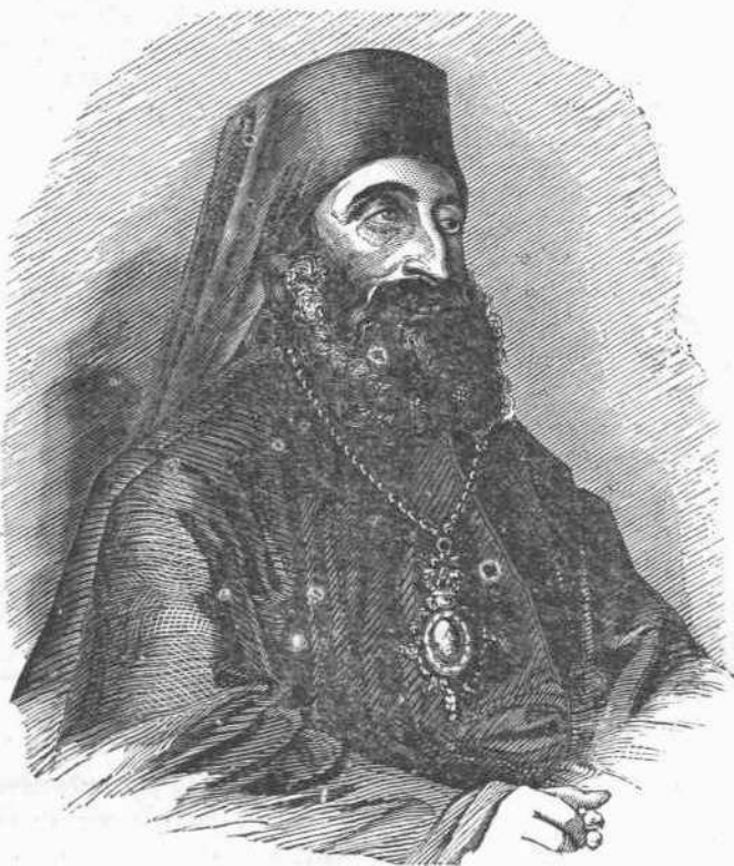
Ἱερόθεος Πατριάρχης Ἀντιοχείας.

Κατὰ τὰς τελευταίας ἐν Συρίᾳ σφαγὰς ὁ μακαριώτατος Ἱερόθεος ἔτυχεν ἀπὸν εἰς Κωνσταντινούπολιν δι' ὑποθέσεις τοῦ κοινοῦ. Ἀλλὰ σπεύσας μετὰ τὸ σφραγιστὸν ἀκουσθῆναι ἐπανῆλθεν ἵνα παραμυθῆσθαι τὸ ποί-