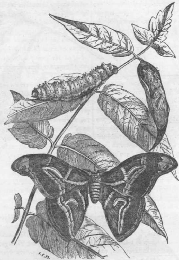
Βόμβυξ, σκώληξ κ.λ. Ἰαπωνίας.