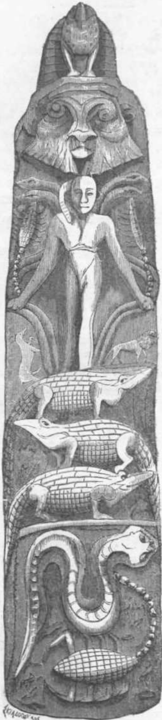
Βαγδατόπουλος ἐσχέδ. Α.