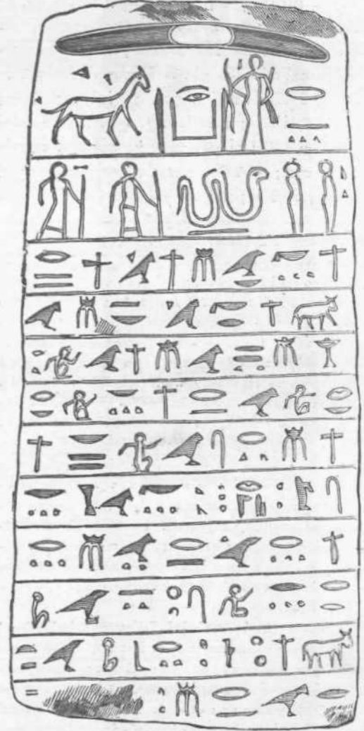
Νερούτσος ἐσχέδ. Δ.