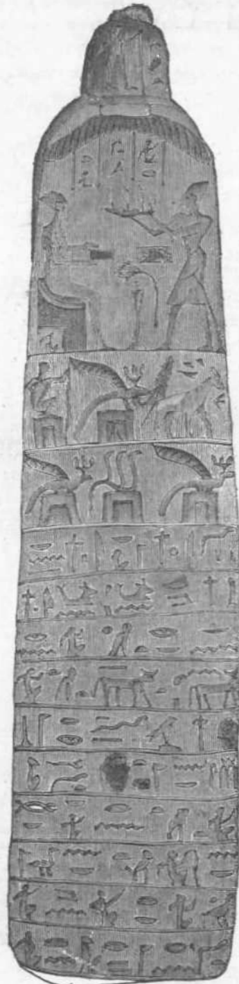
Νερούτσος ἐσχέδ. Β.