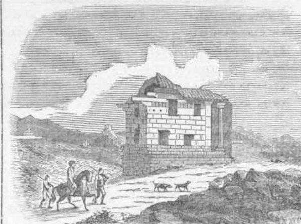
Ἡ γέφυρα τοῦ Σταδίου ἐξ ἀπίπτου ἐν ἔτει 1750.

μένης οὕτω τῆς τε διαβάσεως τοῦ ποταμοῦ εἰς τοὺς θεατὰς καὶ τῆς ἐξόδου εἰς τὴν παναθηναϊκὴν πομ- πην 13) καὶ προλαμβανομένου, λέγει ὁ Chandler, ἐπιλήσμων ὄσων τοῦ Ἰλισσοῦ κατηγορήσε, «παντὸς ἐκ τυχὸν ἐπερομένης πλημμύρας δυσυχήματος 14) .» Ὁ περιηγητὴς οὗτος καὶ ὁ δεκατέσσαρα ἔτη πρὸ αὐ- τοῦ εἰς Ἀθήνας ἐλθὼν Stuart 15) , ἔτι δὲ καὶ ὁ γάλλ- λος καλλιτέχνης Λερούα 16) εἶδον καὶ περιέγραψαν