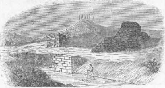
Λείψανα τῆς γεφύρας ἀπέναντι τοῦ Σταδίου.

Μετά δ' αἰῶνας δλοκλήρους σημειώσεις τις ἀνόνη- μος, ἀνήκουσα εἰς τὸ ὑπὸ τῶν γάλλων καποικίων ἰχνογραφηθὲν σχέδιον τῶν Ἀθηνῶν (1670 μ. Χ.), λέγει ὅτι τὸν Ἰλισσὸν σοὶ Ἕλληνας ἀποκαλοῦσι ξη- ροπόταμον , τουτέστι χεῖμαρρον, ἦτοι τόπον ὅπου τὸ ὕδωρ ῥεεῖ κατὰ τὴν ἀφθονίαν τῆς βροχῆς, τὸν δὲ λοιπὸν χρόνον εἶναι ξηρὸς 8) .» — Ἐκατὸν δὲ περι- που εἴτη μετὰ ταῦτα ὁ ἄγγλος Chandler (1764— 1766), ὑπὸ τῆς ὀρυθῆς τῆς καταφρονήσεως σκοτι- ζόμενος, συγγέει τὰ ὕδατα τοῦ Ἰλισσοῦ πρὸς τὰ τοῦ Ἡριδανοῦ, ἐπαναλαμβάνων περὶ ἐκείνων ὅτι ὁ Καλ- λίμαχος εἶπε περὶ τούτων, καὶ ἀσεβῶς μετ' ἐλα- φοῦς πανοπλίας μακροφυλακῶν, ἀντεπεξέρχεται κατὰ τὰ πᾶν ὕδατων τοῦ ἐνδόξου ποταμοῦ καὶ κατὰ τῶν ὑπερβολῶν τῶν ἀρχαίων ποιητῶν. Κατ' αὐτὸν, οὐδ' ὅταν ῥαγδαίως βρέχη, οὐδ' ὅταν ἡ χιὼν ἐπὶ τῶν ὄρεων τήκεται, ἔχει ὕδωρ ἐντελῶς καλύ- πτον τὴν κοίτην ὁ Ἰλισσὸς, ἐν ᾧ κατ' ἔτος ἡμεῖς οἱ παρ' αὐτὸν κατοικοῦντες, τὸν χεῖμαρρον ἰδίως, βλέ- πομεν ὅτι ἐπὶ ἡμέρας πολλὰς, πολλάκις καὶ μέχρι