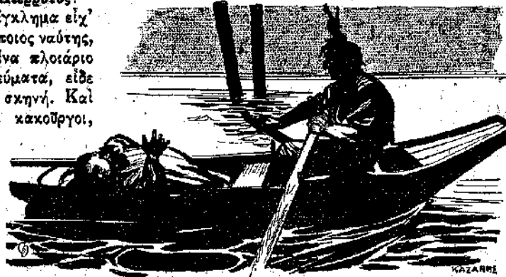
«Κι' εδωσθηκε να φθάση στην όχθη.» (Σελ. 349, στ. α').

Στη άναμεταξύ αυτό, ο ναύτης είχε βγη έξω και διηγούταν στους άλλους