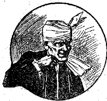
«'Από τη βία του να ντυθή...» (Σελ. 349, στ. β').