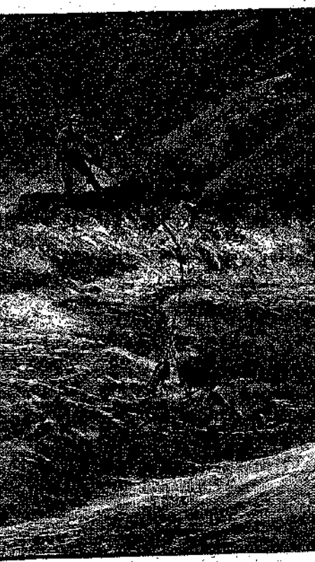
Ο Φρίτς έπεσε στη θάλασσα... (Σελ. 125, τε. α')

Άλλά τα πουλιά αυτά ήταν άπληοιστα. Του κάκου προσπαθούσαν να τα ζυγώσουν, όταν κατέβαιναν σ' άκρωτήρι πετούσαν άμέσως και γινόταν άφαντα πίσω από τη βραχοσειρά.