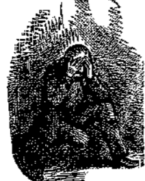
"Έκλαψε τόσο, όσο δεν έκλαψε σ' όλη του τή ζωή..."

"Τό άχάριστο! ψιθύριζε καταπνίγοντας τούς λυγμούς του μέ τό μαντήλι του, — τό μεγάλο έκείνο κόκκινο μαντήλι μέ τὰ τετράγωνα, πού κι' αυτό τό περιγέλασε άρκετά ή νεολαία του χωριού. Τό άχάριστο! εγώ πού τ'είχα χαρά μου καί καμάρι μου πού τό στόλισα έτσι καί τόκαμα τόσο όμορφο!... "Ακούεις νά υποφέρω τόσα, νά κοπιάζω μερόνυχτα, γιά νάναθρέψω ένα κακοκρίτσι, ένα τιποτένιο κορμί! "Ακούεις έκεί νά ντρέπεται κοντά μου καί νά μέ θέλγη καλο ντυ μένο γιά νά καταδέχεται νά λέη πώς είναι κόρη μου! »