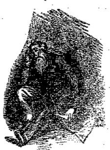
"Ως πού τόν πήρε ό ύπνος..."

Κι' εξακολούθησε μέ τόν ίδιο τρόπο τούς συλλογισμούς του: