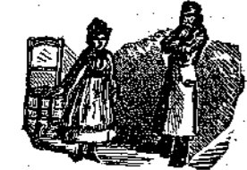
"Τήν κοίταζε μέ σταυρωμένα χέρια..."